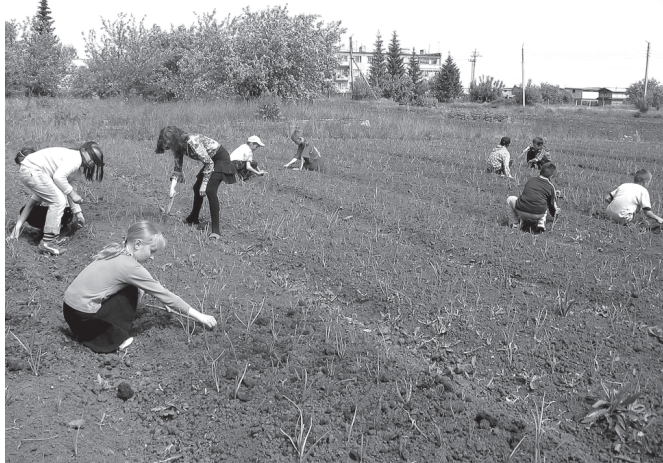
Ачаран ёсе хăнăхса ўсетпĕр.

четĕнче Муркаш лицейĕпе Кашмаш шкулĕ сĕнтерĕçсем пулса татĕс. Сиплев лагерĕсен воспитаникĕсемпе ёçлеме шкулта ёçлекенсене, физкультура учителĕсене, ачасемпе самраксен спорт шкулĕн тренерĕсене, медицина ёсченĕсене те явăстарма тивет. Чи малтанах вара су кунĕсенчи ёç-хĕлле тулли мар, сителĕксĕр пуранакан ĕмĕсенчи, талăх ачасене тивĕстернĕ.