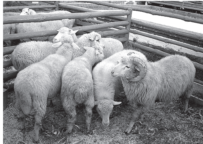
«Герой» хусалăхран килнө «Цыгайская» аратлă сурахөсем хайсене пăхнине кура суллен 100 сурах пусне 102-103 пүтек, 4,6 кг сям парасщө.