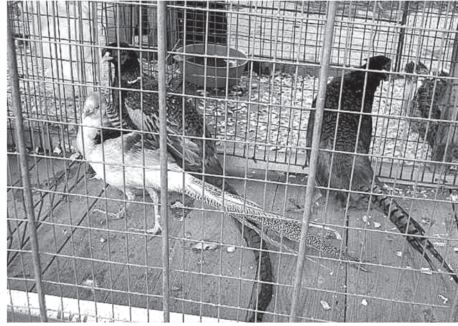
Фазансем (сунара сүремеллисем, Румыни аратлисем, кёмөл тата ылтăн төслисем) курава пина кашни синах төлөнтөрчөс.

мөш стөпеньлө аттөстатсене, «Ориноно» ял хусалăх производствө кооперативенчен килнө 13-15 уйăхри тына 3-мөш стөпеньлө, 16-18 уйăхри тына 2-мөш стөпеньлө аттөстатсене тивөсрөс. Курава тухнă А. Афанасьев хресчен (фермер) хусалăхөн сыснисем вара Тав сырăвөллө пулчөс, малашлăх валли ыра урок илчөс.