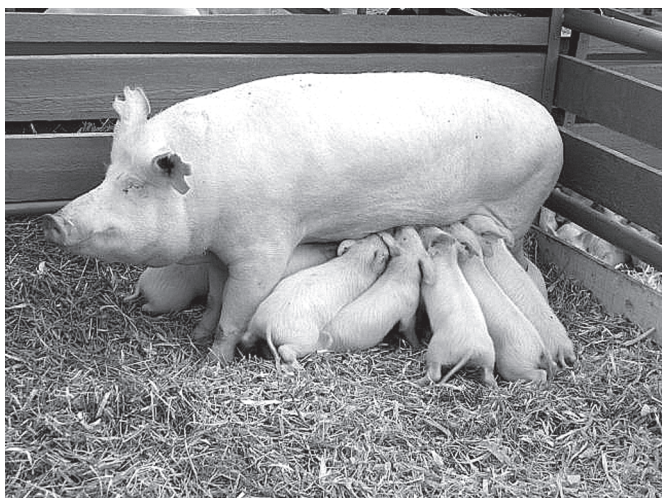
«Свобода» аратлă вьльăх ёрчетекен заводри сысна амисем суллөнөх пысăк тухăспа савантарасщө.