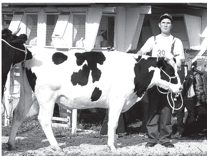
Аренăра – «Ориноно» хусалăх.

Чөпсене кёркунне шутлама хушна ытарлă сăмахсем – ял хусалăхен кирек хăш отрасленче ёслекенсемшөн те пурнăс төрөслөхө. Халăх хусалăхенче ёслекенсемшөн пăхса тунă кашни утам ылтăн пёрчипех танлашат темелле. Сакна пурте пелетпөр, анчах анасысем вай илччөр тесе сөнөлөхсене тата сөнө технологисене пурнăса кёртме тытанса таратпөр. Кайран вара хамър наянлăхамăра пытарма тарашса «султисене» ятланси таватпөр: сак хаклава пăхсан, хаксем уснишөн, вөсем пире майлă марришөн, ёс условийөсем хамăра тивөстөрменишөн пирөн пөр айап та сук. Сав вăхăтрах кёршөр хусалăх аталану сулепе пырат, сөнө техникапа, ытларах продукциллө вьльăх-чөрлөхпе ёслет. Астаха аталанупа юханчак чикки? Сак ыйту сине тулли хурав пачө те ёнтө сенябрөн 26-мөшөнчө «Чувашское» пёрлешүре аратлă вьльăхсен республикари куравө.