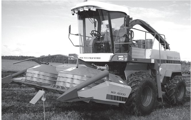
Вильях апаче хатерлемелли 290 лаша вайлэ «Дон-680М» комбайн.