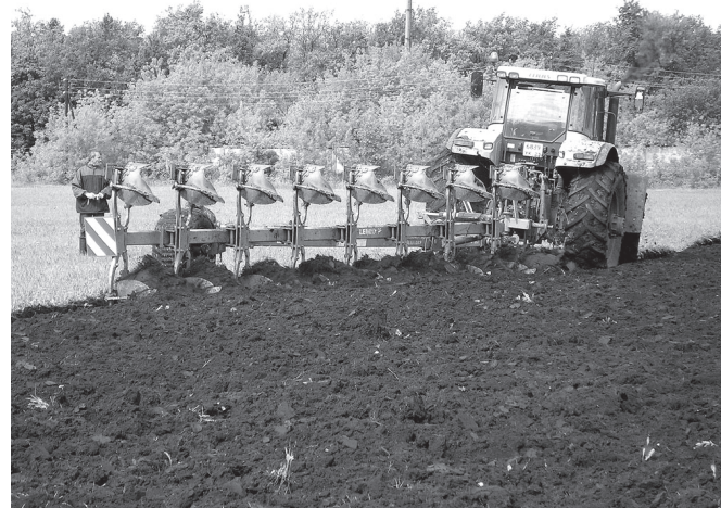
Каллё-маллё савранакан суха пуё ёслесе катартре.