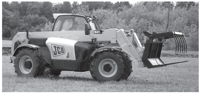
Великобританире каларна «GCB» погрузчк ута-улам та купалайраты, пёрене те сёклейрет.