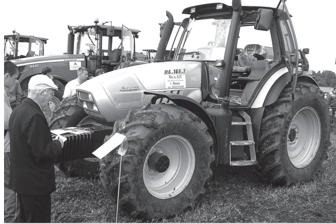
Итали тракторэ «Ламборджини Р6120» 3 миллион та 600 пин тенкё тараты.