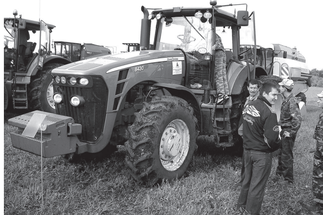
Америка тракторэ «Джон Дир-8430» хирти ёсёсөнче шанчакла.