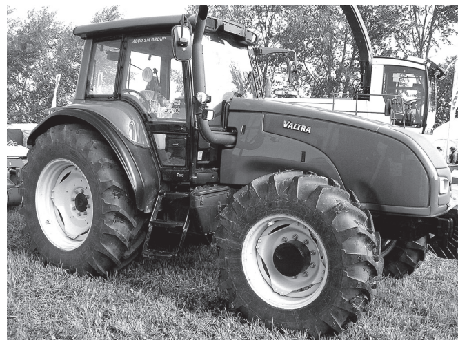
185 лаша вайлэ финн тракторэ «Валтра».