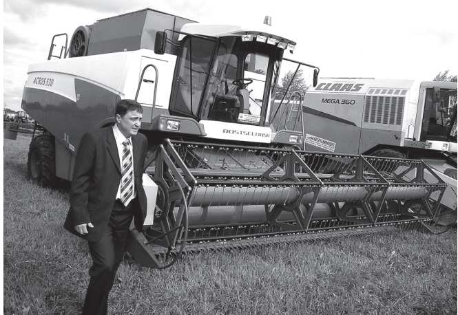
250 лаша вайлэ «Акрос-530» «хир карапэ» 9 метр сарлакаш қасалак илет.