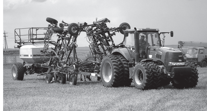
Тыр акмалли комплекс сёре калкалататы, акасть, минералла удобрени хываты, пусарантараты. Сеялка сарлакашне 5 метран пулса 18 метр чухлё ырнастарма пулаты.