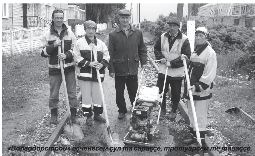
«Волгодорстрой» ёсченёсем ҫул та сарасё, тротуарсем те тавасё.

«Строитель – мирлё профессия», теҫсё те, ҫак ҫанлаха эфир хамар ёсёмерпе пурнаҫа кёртетпёр. Чавашемшён юлашки ҫулсенче республика кунё пысак пёлтерёшлё уява ҫавранчё. Уява вара тирпей-илемсёр кётсе илме ҫук. Пирён халәхамар йәлине ҫапла вёл. Республика пирён ҫурт пулнәран килең-кайна ханасем малтан эфир мёнле ҫуртра пу-