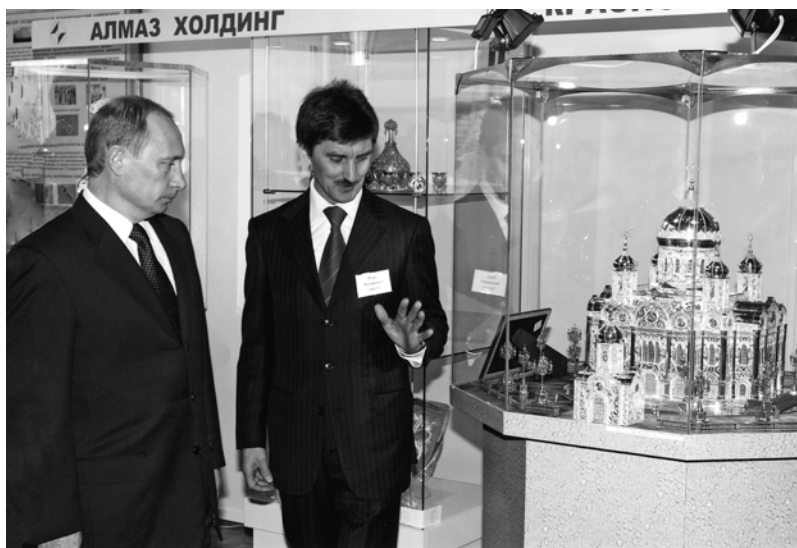
«Алмаз-Холдинг» - единственная российская ювелирная компания, с продукцией которой ознакомился президент страны Владимир Путин. Своё восхищение работой мастеров холдинга он выразил одной и очень емкой фразой – «Фантастика!»

«Алмаз-Холдинг» – крупнейший в России производитель ювелирной продукции. В состав этой компании входят старейшие ювелирные заводы России и мощная разветвленная торговая сеть практически во всех регионах. Эта компания успешно вошла в ювелирное сообщество страны. Украшения, создаваемые мастерами фирмы, хорошо известны и россиянам, и ценителям ювелирного искусства за рубежом. Ювелирная компания «Алмаз-Холдинг» работает на российском рынке с 1993 года, и за это время стала одной из ведущих ювелирных компаний. Наследуя лучшие традиции российского предпринимательства, «Алмаз-Холдинг» является одним из крупнейших инвесторов российской ювелирной промышленности.