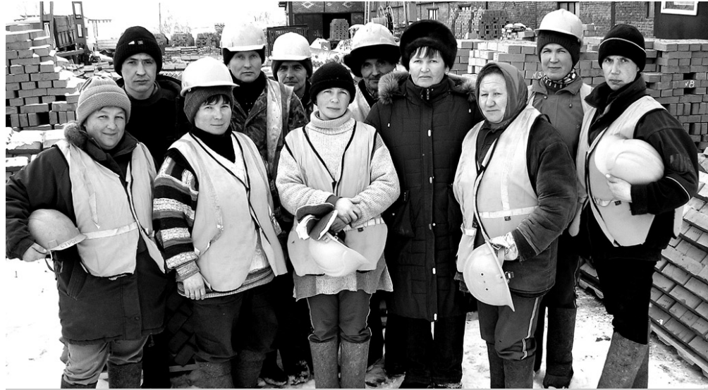
Туслә сөмёе сөнё тёллөвсемпе ёслет.