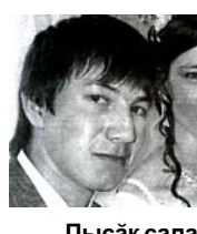
Пысак салампа Корнеевсен тата Одиңцовсен сөмийсем.

Юратнә сыннәмәра сав тери ёсчөн те түрө чунлә пулнәран, эпир хамәр та сак төнчөре хавәтсәр марине, телейлө пуллине туйтләр. Пурнаҥсәр турләх та вәрәм пултәр. Иксёлми вай-хал, тулли телей, кулленех хөвөллө те сүтә кун, пархатарлә сирёл сывләхпа ёмөрхи ыр қамәлләх сунатпяр, хисеплө Перасковия Ильинична.