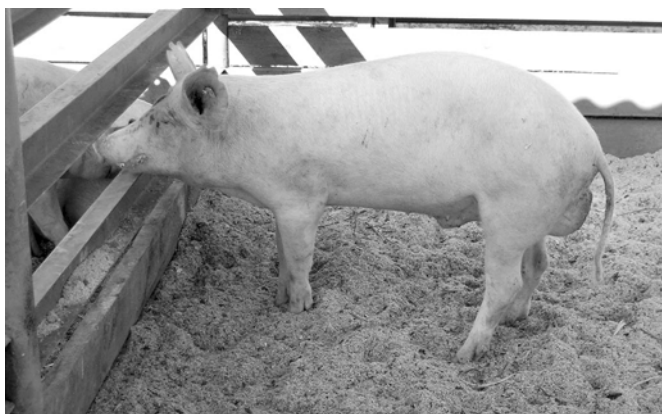
"Чемеево" хушалахри сэмрэк сысна аси. Кэсал чемеисем ёратлэ сысна аси 31 пуэ сутнэ.