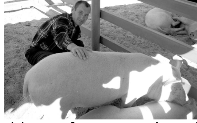
А. Александров Суворов яч. хис. хушалахран килнэ ёратлэ сыснасемпе.