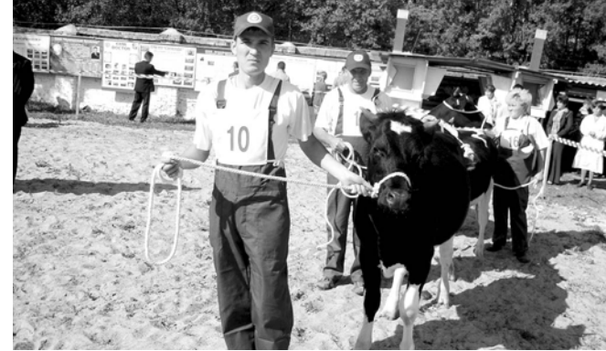
"Оринино" хушалах аренэра.