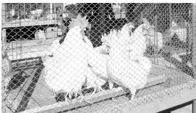
"Моргаушская" чэх-чёп фабрикин выставкэн 1-мёш степенёлё аттестатне тивёснё чэххисем.