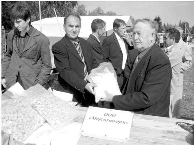
"Моргаушкорм" ООО выставкэна пьнисене хэй патне паха апатпа илёртрё.