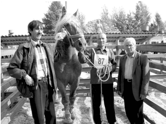
Куравра лашасем те кусран тухса ўкмерёс.