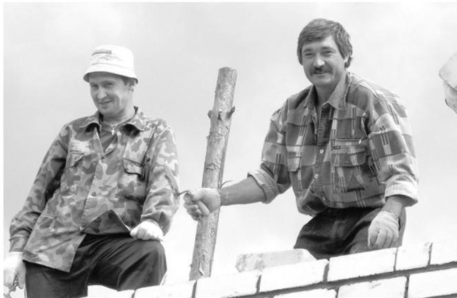
Ю. Михайлова В. Жоржиков кирпөч хурас өсрө ытисенчен кая юлмачсө.