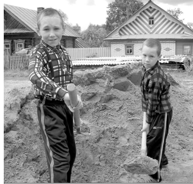
Эпир пөчөкрөх, анча хайрө ыватма пуларатпәр!

суралнаскер, 21 султа Сатракассине качча тухат. Килте те стройкәран ют пулманскерөн хайне валли йәва саварсан та сак өсрөн айккалла паранма тивмест. 37 сул хушшинче унан машарө, ачисем, таванөсем, ял сыннисем пулашнине касал пуранмалли иккөмөш сурт, икө хутчен сарай тума тивет. Мөн чуль вай, тарашулач хушшинчө... “Шыв сиелте вырәнта пуранатпәр та өлөкрөх сирөпө яман никөссем выляса стенасене сурса ярассө. Кил хушин кунне пер паата сапмалла тенине шуга илсе кашни юханаканах вахатра юсама тарашатпәр. Акә 2004 султа кирпөч сарая сүтсе сөнөрен купаларамар”, – каласа парать хай тунә өсрөн ютшанмасар З. Павлова.