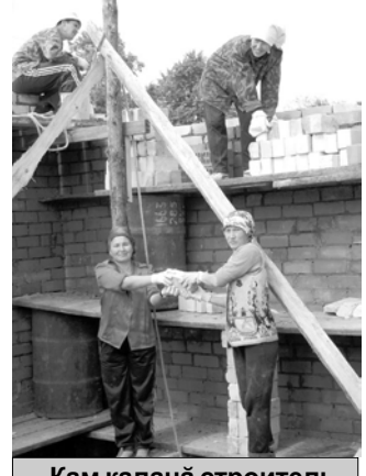
Кам каланә строительство өсө хөрараман өсө мар тесе?