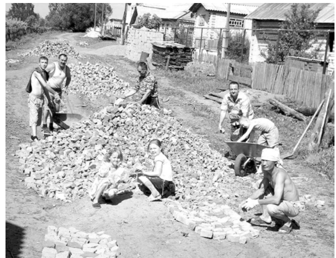
Халәх тәрәшсан күлө мар, сұл та пулать.