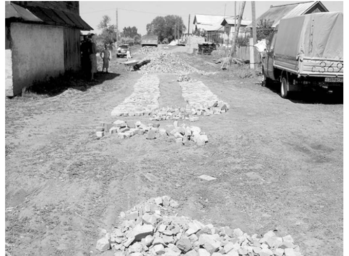
Кирпёч вакки сарна сак сұл сичне вәхәт иртсен вак чул та выран түпё.

Юлашки сүлсенче райони ялсен сән-сапачё улшанмаллипех улшанчё. Сөнё суртсем тата вёсене хавәрт тумя пулашакан сөнё конст-