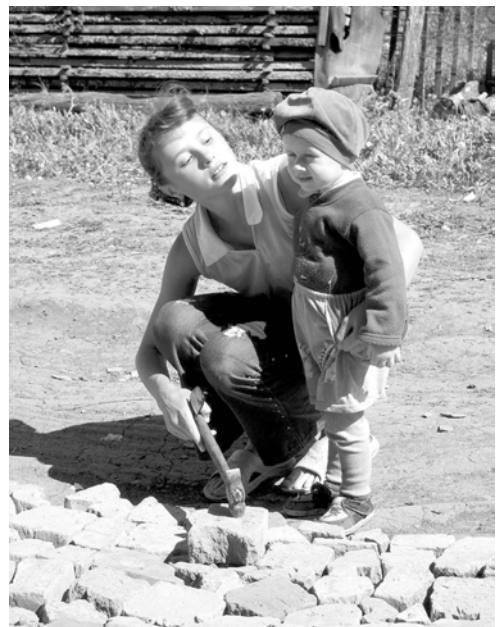
Эпё тата арсын мар-им?..

тесе ала уснипе нимён те пулманни кашниншёнөх палла. Апла пулсан үсөмлө пуранма пулин те пёр сын пек санә таварса ёсе күлёмелле.