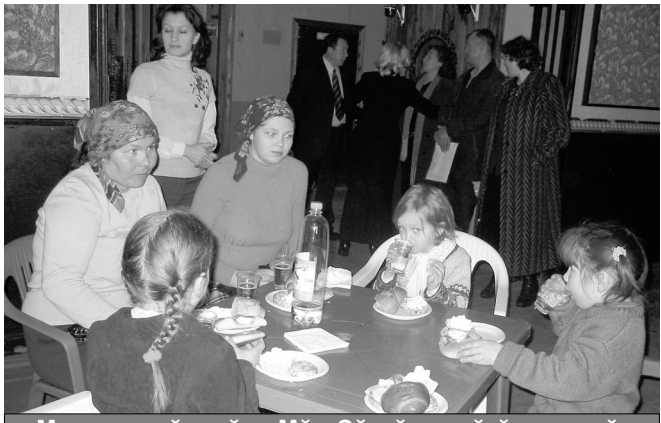
«Муркаш райовёпе Мән Сёнтёрти җакәр заводёнчө ая-йя тутлә сёмёсем хатёрлөсчө иккен».

килекенсем те йышлән пулчөс. Вёсем хайсен сөнө хуҗисене түлөс-ха. Уявра вара сүлрөх асаннә сумма татах та үсрө, мөншён тесөн залра ларакан ачасемпе ашшө-амәшөсемсёр пусне районти предприятисемпе организацисен ертүсисем те чылай пулчөс.