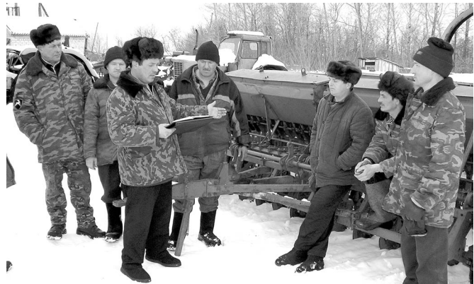
Сур акиченхи вәхәтпа туллин усә курар.

мерөмөр: сывхаракан сур акине 3 Беларусь, пөр Т-150, пилөк ДТ-75 хутшәнмалла. Кустәрмаллә тракторсем ёсө хатёр, Т-150 тракторәнне двигательне юсарәмәр та аһа вырәнне вырнас-тармалла сөс, дизель трактор-сем тёлөшпе хәш-пөр юсав ёсөсене ирттермөлле. Парк аләкөсене аплипех усса хурсан, хәш-пөр запас пай-сем «ураланасран» тата хатёрленү ёсөсөем нумаях мартан парк территорияне юртан тасатмарәмәр-ха, – тет сур акине планланә хут сине пәхса хушаләх ертүси А. Соловьёв кәсал 452 гек-