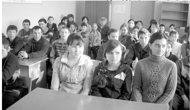
Шута илмелли, аса хывмалли сахал мар...

– Президентәмәр кәсалхи сүлталәка ачапа ача аманө халаллани республикәмәр шав малалла туртәннине сирөплө-тет. Ача сүлталәкө тени вәл ача суратмалла тенипе сөс түр кил-мест. Кун сүти панә ачана тёрөс воспитани парса пурнәс сүлө сине кәларасси вара об-щественнәс тивөсчө те. Прези-дент хайөн Сыврәвөнче ачасем