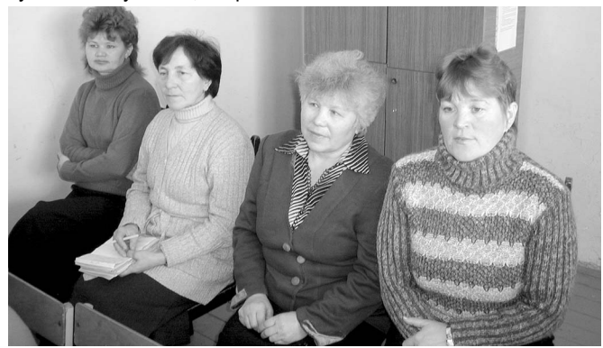
Пушар хәрушсәрләх культури вөрөнтү культури-чен юлмасть.