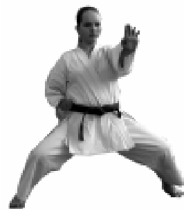
КАЛАЙКАССИНЧЕ МАТТУР ХĖРСЕМ ВĖРЕНЕÇÇĖ