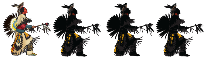
Индеп хайн ёмёлкине сухатнй. Ачасем, апа ёмёлке шыраса тупма пулшяр-ха.