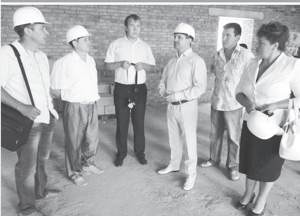
Пёчөк тата ватам бизнес

илемлөх салонёсенчи, парикмахерскисенчи ёссем тата йттисем те керёсчө.