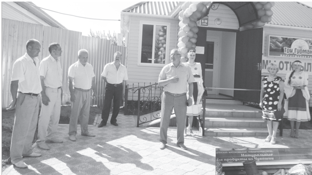
Районта пурәнакансене иртнө эрнере Муркаш райповө черетлө парнепе савантарчө. Кунта «Три Гурмана» сёне лавкка усалчө, сутләхра – Етёрнери аш-паш комбиначөн продукциё.