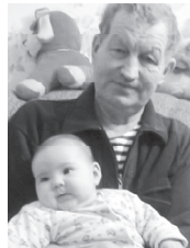
Саламлаканёсем: мәшәрә, херёсемпе керёшөсем, мәнүкёсем.

Саламлаканёсем: амәшө, мәшәрә, ачисем, мәнүкө, 3 аппәшө, 2 йыснәшө, 2 пиччөшө, 2 инкөшө, тәванёсем, пускилсем.