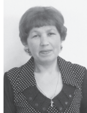
Саламлаканёсем: херёпе керёшө, ывәлө, мәнүкёсем, аппәшөсемпе йәмәкёсем, хәти-тәхләчисем, тәванёсем.

Саламлаканёсем: 2 херё, ывәлө, керёшөсем, 7 мәнүкө тата тәванёсем.