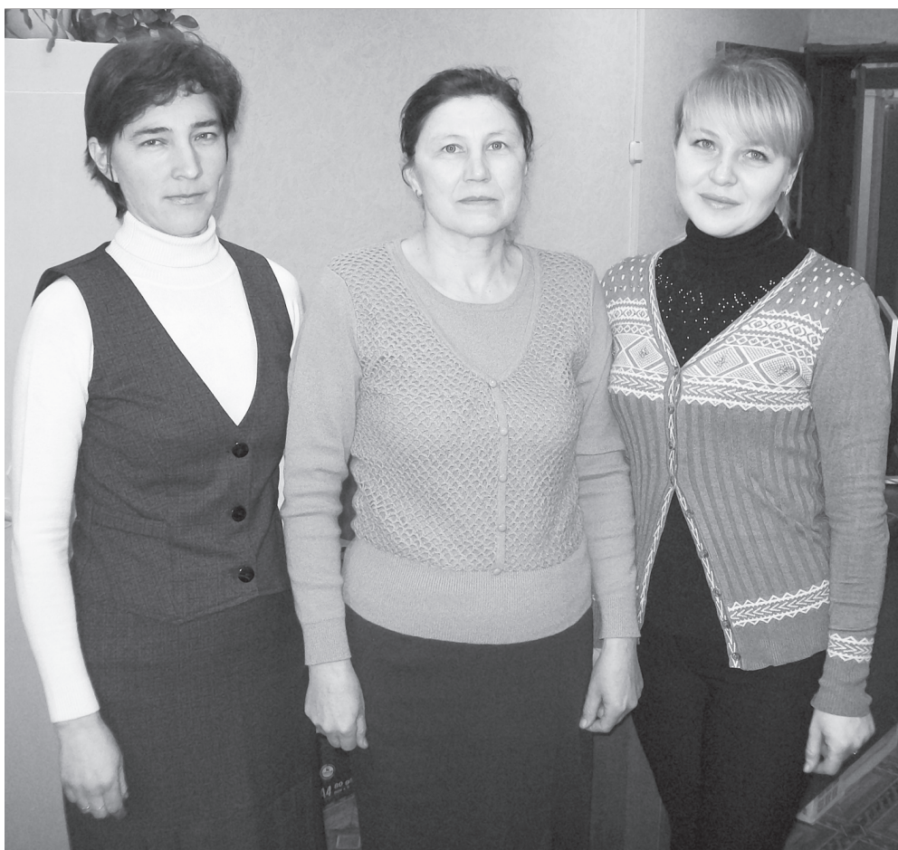
Ыран – Пётём тёнчери хĕрарăмсен кунё