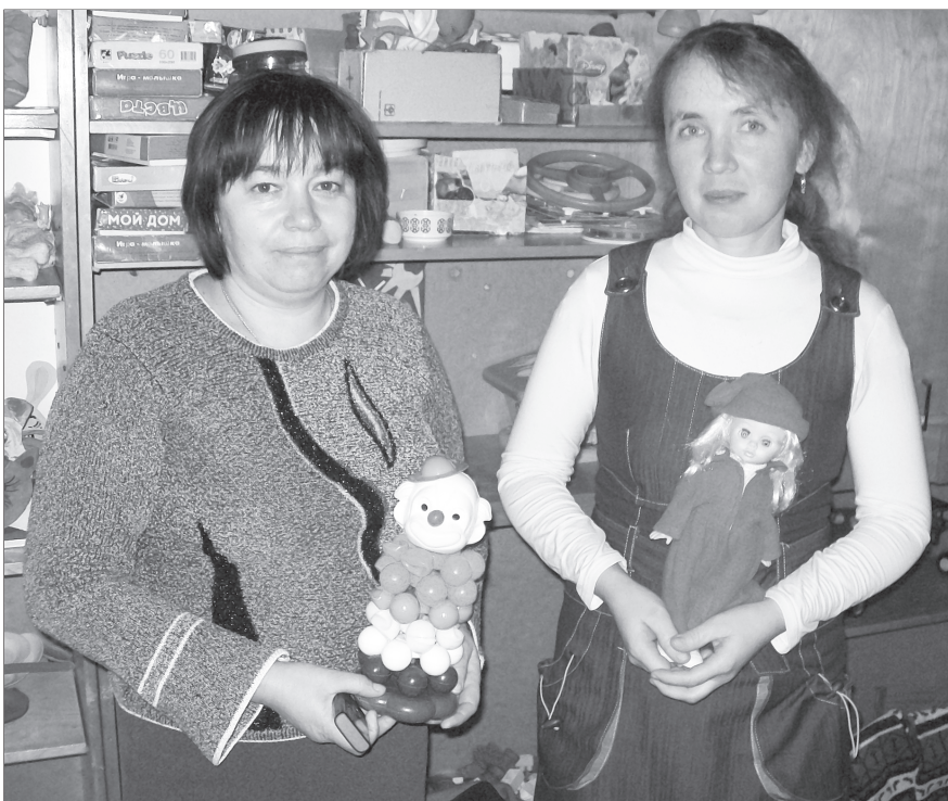
Вёсем ёсёпе хастар