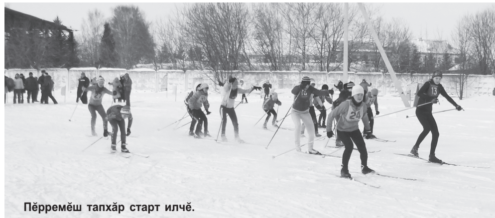
Пёрремеш тапхәр старт илчэ.