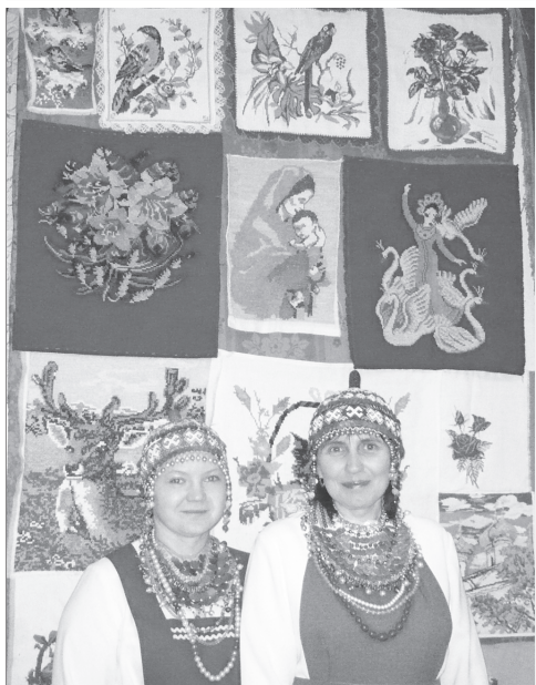
Сән үкөрчөкрө: еплө эрш, еплө илем!

Турайри информөципө культура центрө сөмөнчи Анаткассинчи Культура сүртөнчө «Чөчөклен, юратнә Турай өн» чаршав усәлнөпө пусләнчө кунти пултаруләх ушкәнөсөн кончөрчө. Пухәннисөнө Турайри, Анаткассинчи пултаруләх ушкәнөсөм, Мән Токшикири «Тәванләх» халә пултаруләх ушкәнө хәйсөн юрриташшипө савәнтарчөс сав кун.