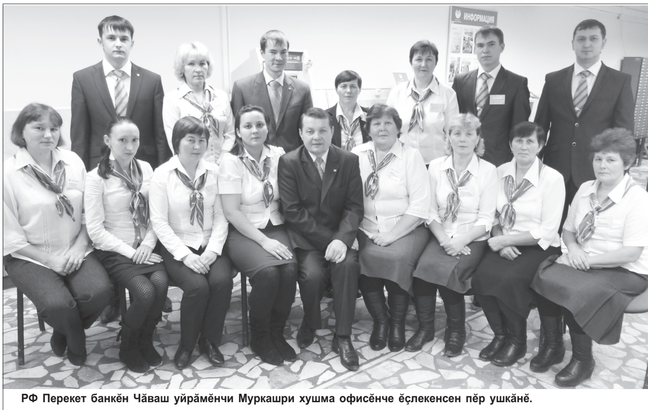
РФ Перекет банкән Чәваш уйрәмөнчи Муркашри хушма офисәнчө ёслөкөнсен пёр ушкәнэ.

пур чухне те сервис пахаләхне үстерөсси. Ана пурнәса көртөссишөнөх Перекет банкё тәтәш сөнөлөхсене пурнәса көртет. «Клиент яланәх төрөс» тени пирён кашни сотрудникшән төп пөлтөрөшлэ.