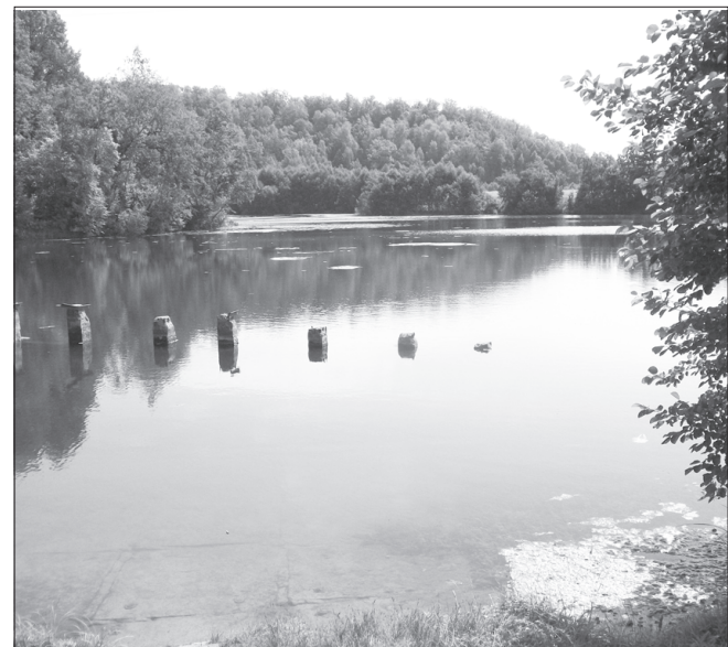
Су илемне хёл ыйхипе улаштарма хатёрленет ял пёви.

Чук уйахён 23-24-мешесем. Органикәлла шёвё удобрени хывма меллэ кунсем. Куршаксенчи тапрана калкалатмалла. Пүлёмри үсен-таран сатарҥасемпе керешмел-