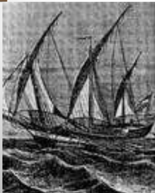
корабль с чёрными парусами