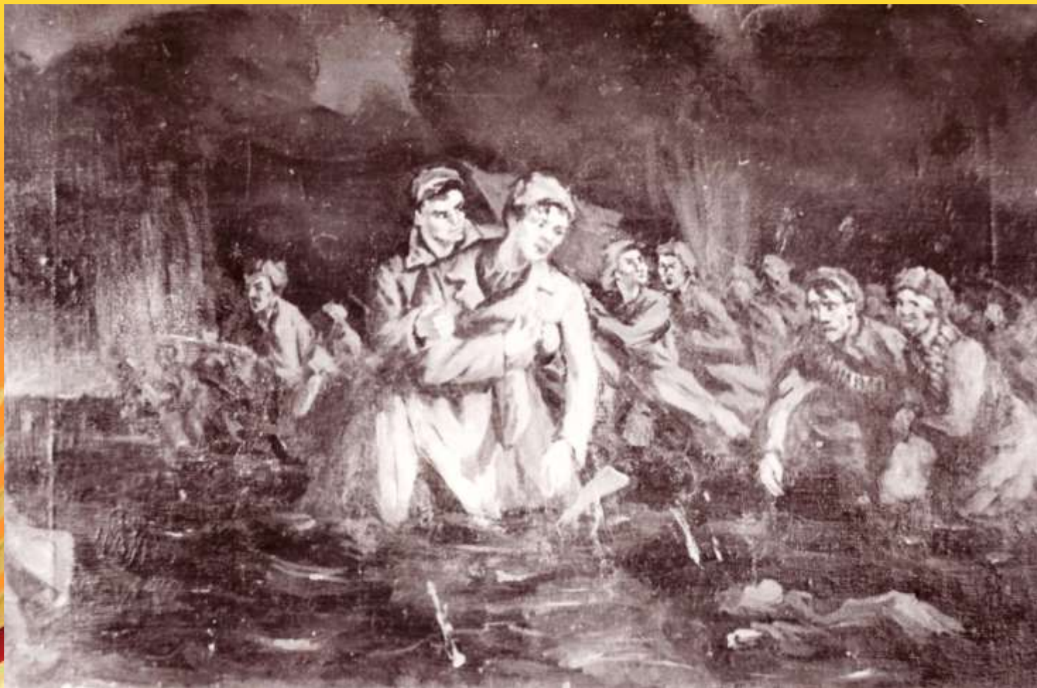
Картина неизвестного художника «Гибель Иванова Прохора», 1958г.