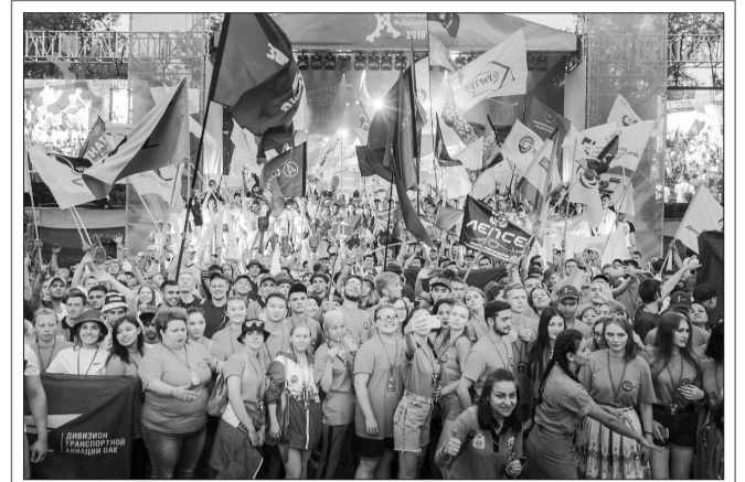
Так выглядело открытие форума «Инженеры будущего - 2019».