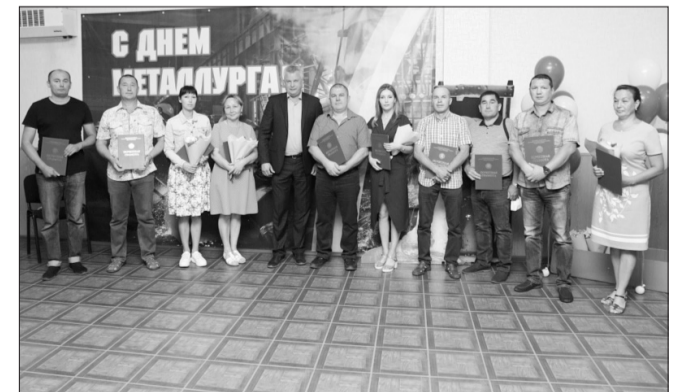
Материал предоставлен республиканской организацией профсоюза работников АСМ.