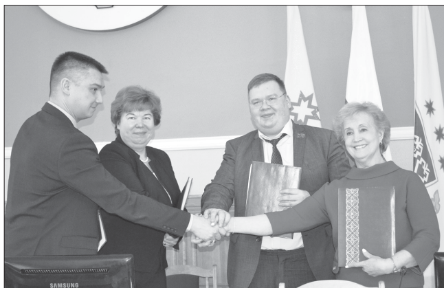
Окончание на с.4.

В рамках реализации принципов социального партнерства в сфере труда в городе Чебоксары сложилась эффективная практика заключения четырёхстороннего отраслевого соглашения