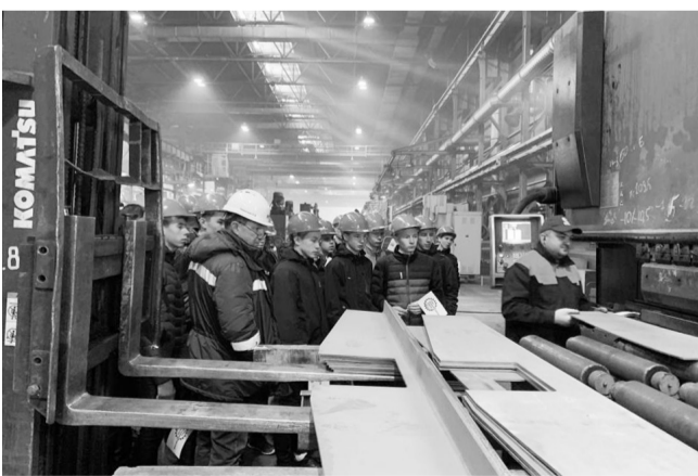
Материалы предоставлены республиканской организацией профсоюза работников АСМ РФ.