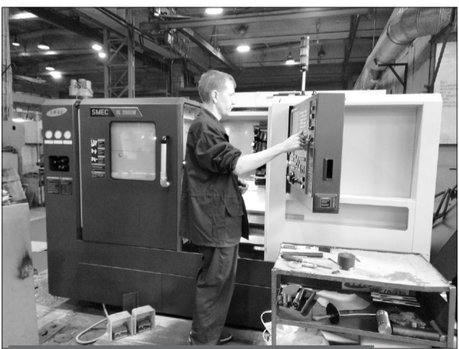
Токарный обрабатывающий центр MEC SL2500BM