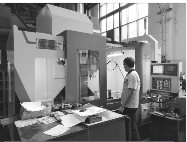
Вертикальный фрезерный обрабатывающий центр с ЧПУ

В нынешнем году компании «Техмашхолдинг» значительно обновили имеющийся парк станочного оборудования.