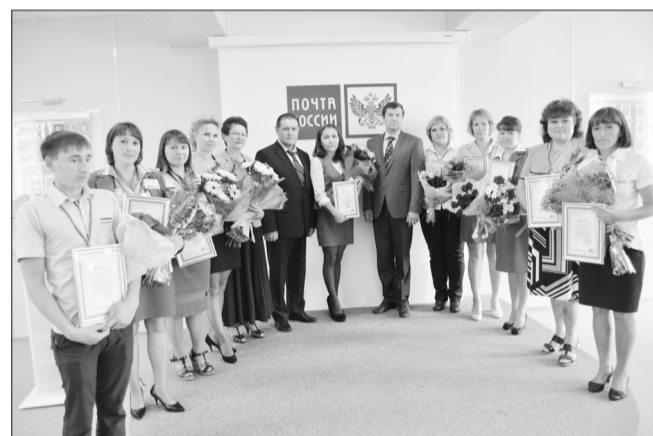
Материал предоставлен республиканским комитетом работников связи России.