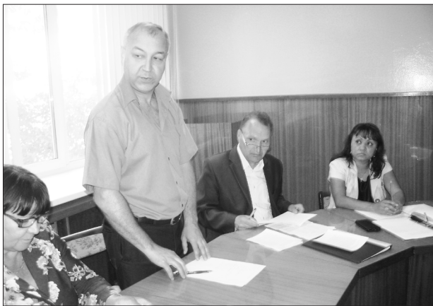
Окончание на с.2.

26 июня 2014 г в Доме союзов состоялось очередное заседание президиума Чувашрессовпрофа. Заседание началось с награждения победителей фотоконкурса «Профсоюз в лицах. Человек труда». Фотоконкурс посвящался Всемирному дню охраны труда – 28 апреля и проводился с 26 марта по 24 апреля 2014 г.