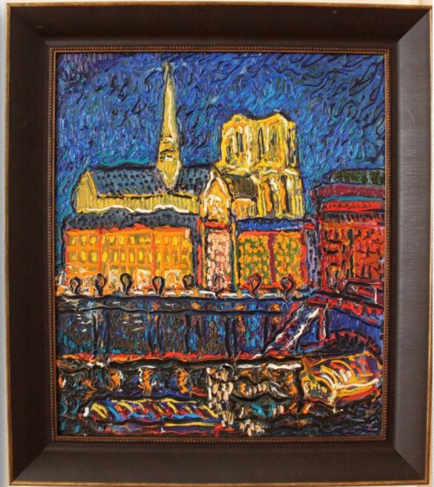
«Ночной Нотр-Дам-де-Пари» 2008

Знаменитый Мулен Руж, Елисейские поля и величественный Нотр-Дам-де-Пари, тихие французские улочки. На полотнах Владимира Ларева они запечатлены не такими, как на классических работах мастеров XIX века.