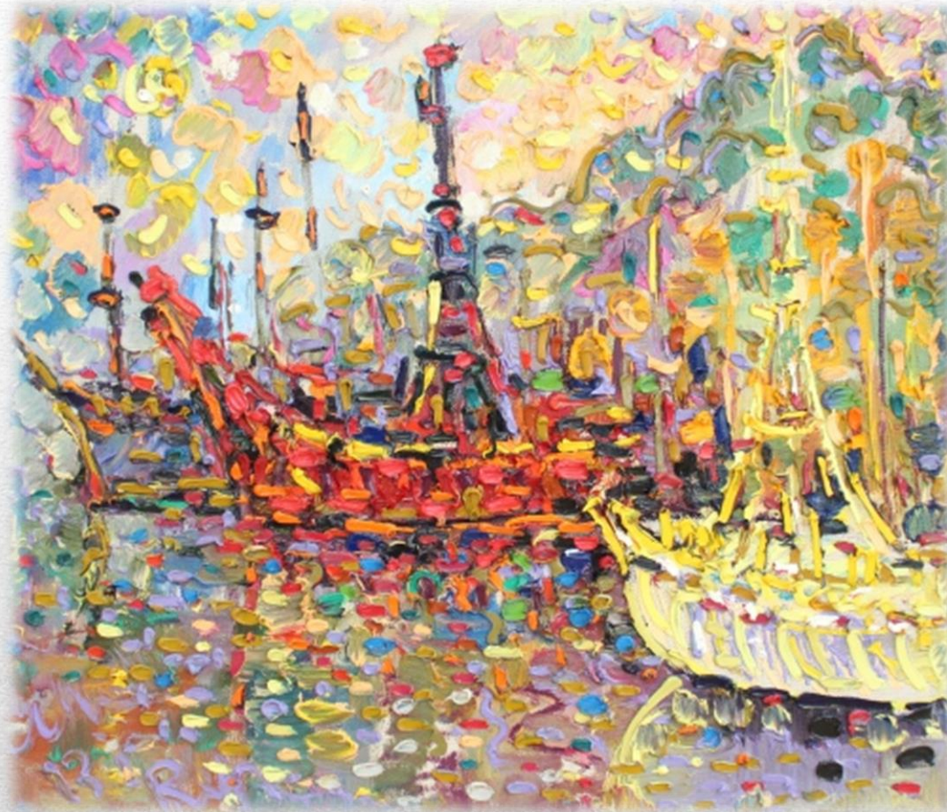
«Север Италии «Лагори» 2012

Он пишет даже не столько сам пейзаж или людей, а вызванные ими собственные ощущения. При этом не придерживается какой-то определенной техники рисования, не боится экспериментировать, ориентируясь исключительно на собственную интуицию. При виде его работ, ощущаешь особую радость и праздник.