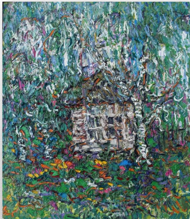
«Детство моё» 2011