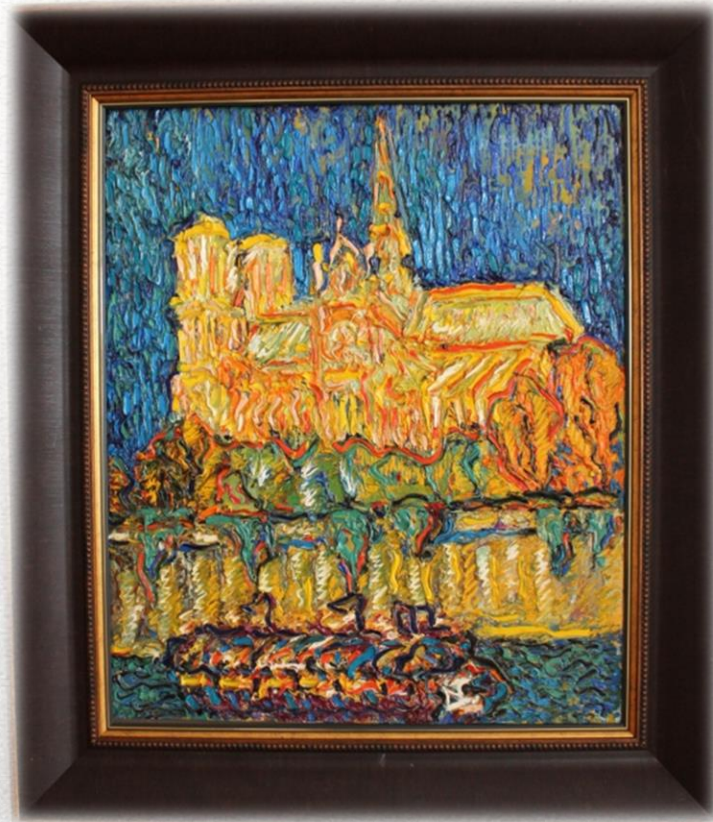
«Огни Парижа» 2008