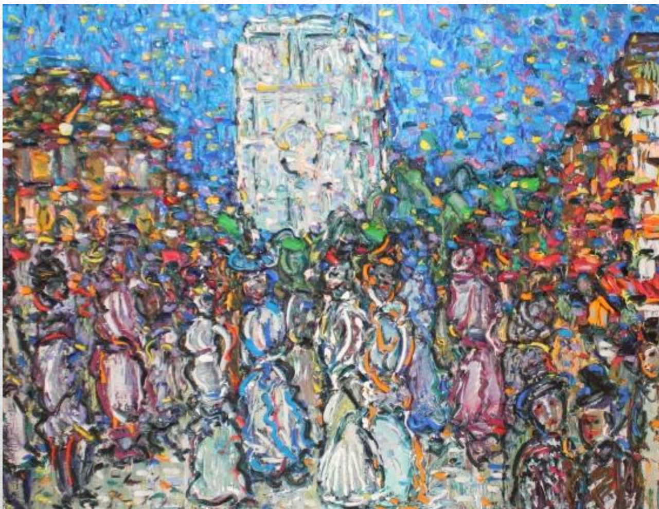
«У Нотр-Дама» 2008