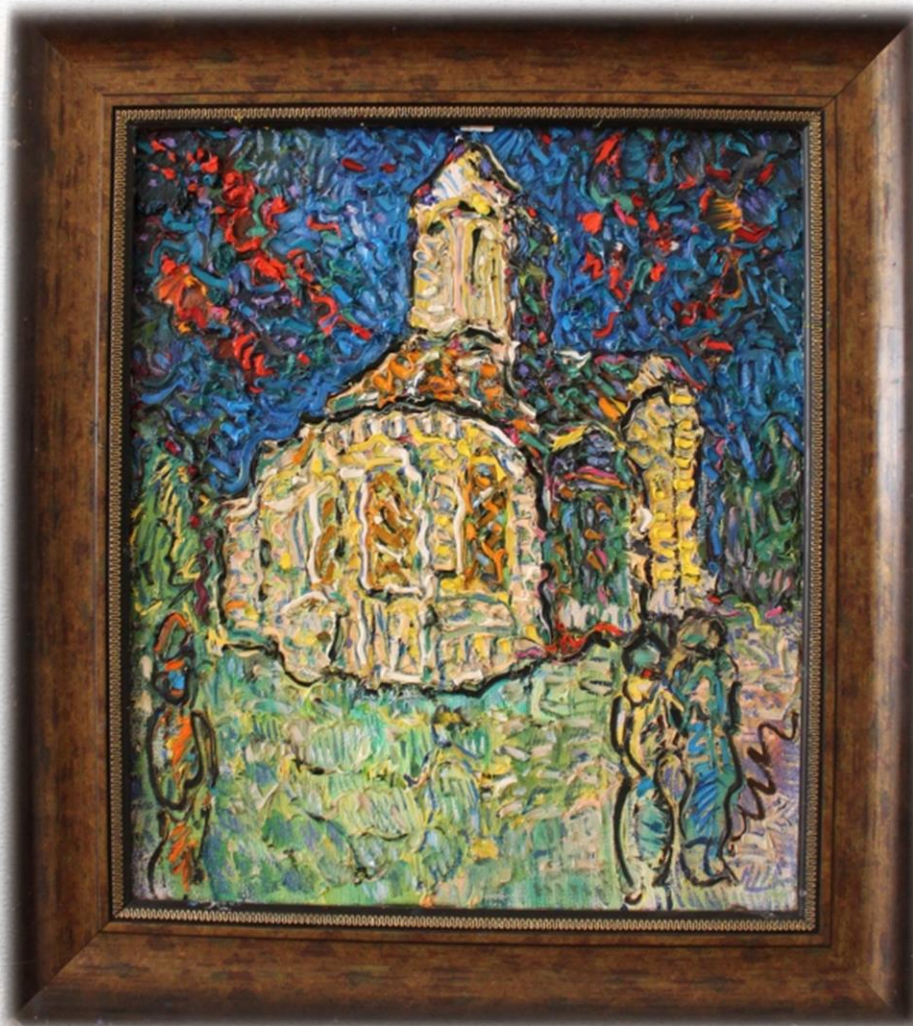
«Прованс. Церковь в Овере» 2009