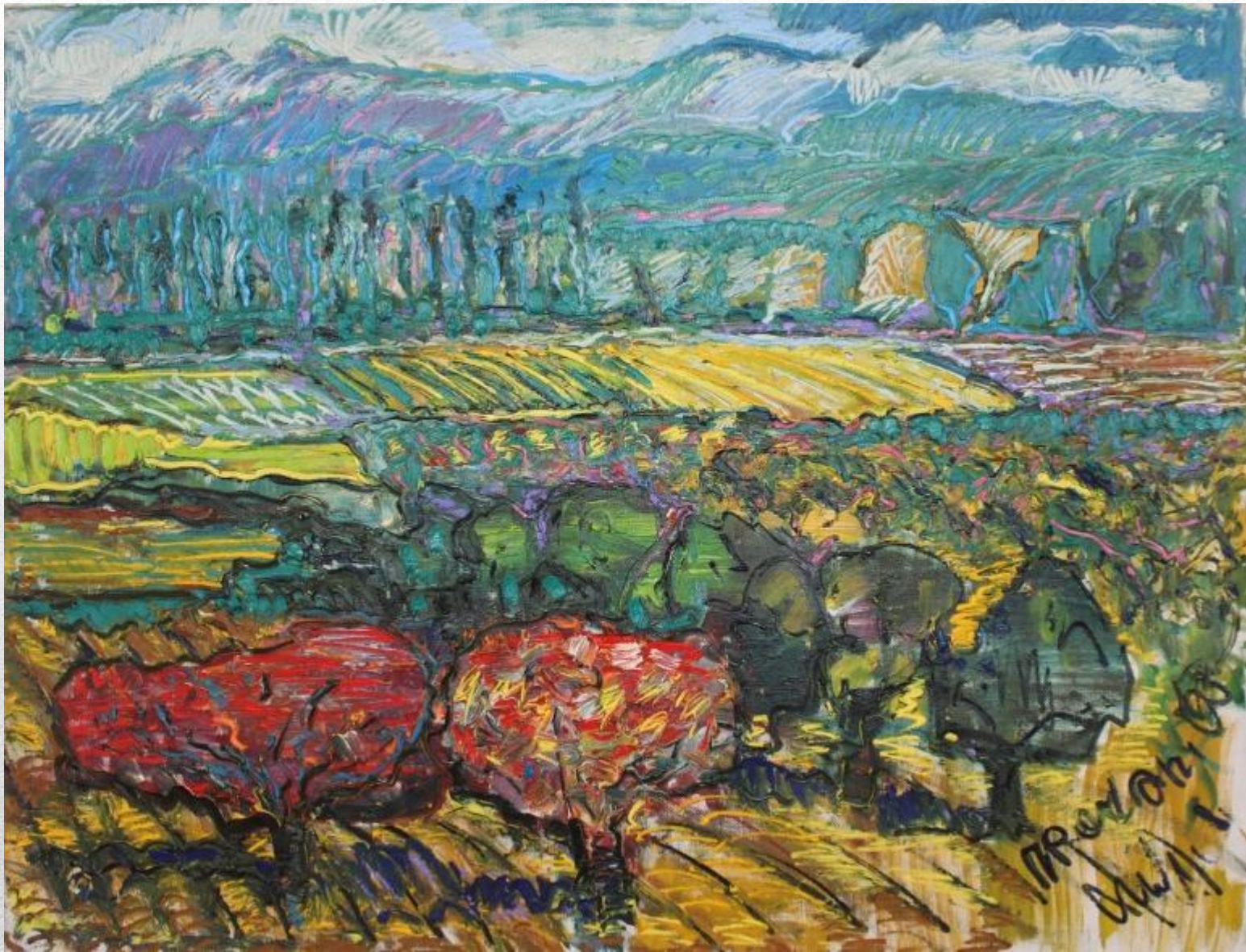
«Прованс. Из цикла « Мои похождения по местам Ван Гога» 2008