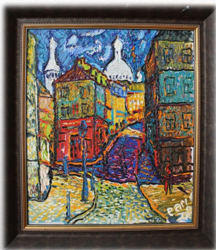
«Франция. Утро Монмартра» 2008