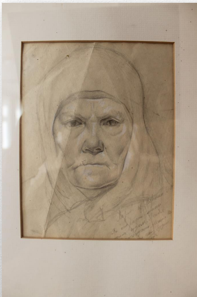
«Портрет матери» 1977