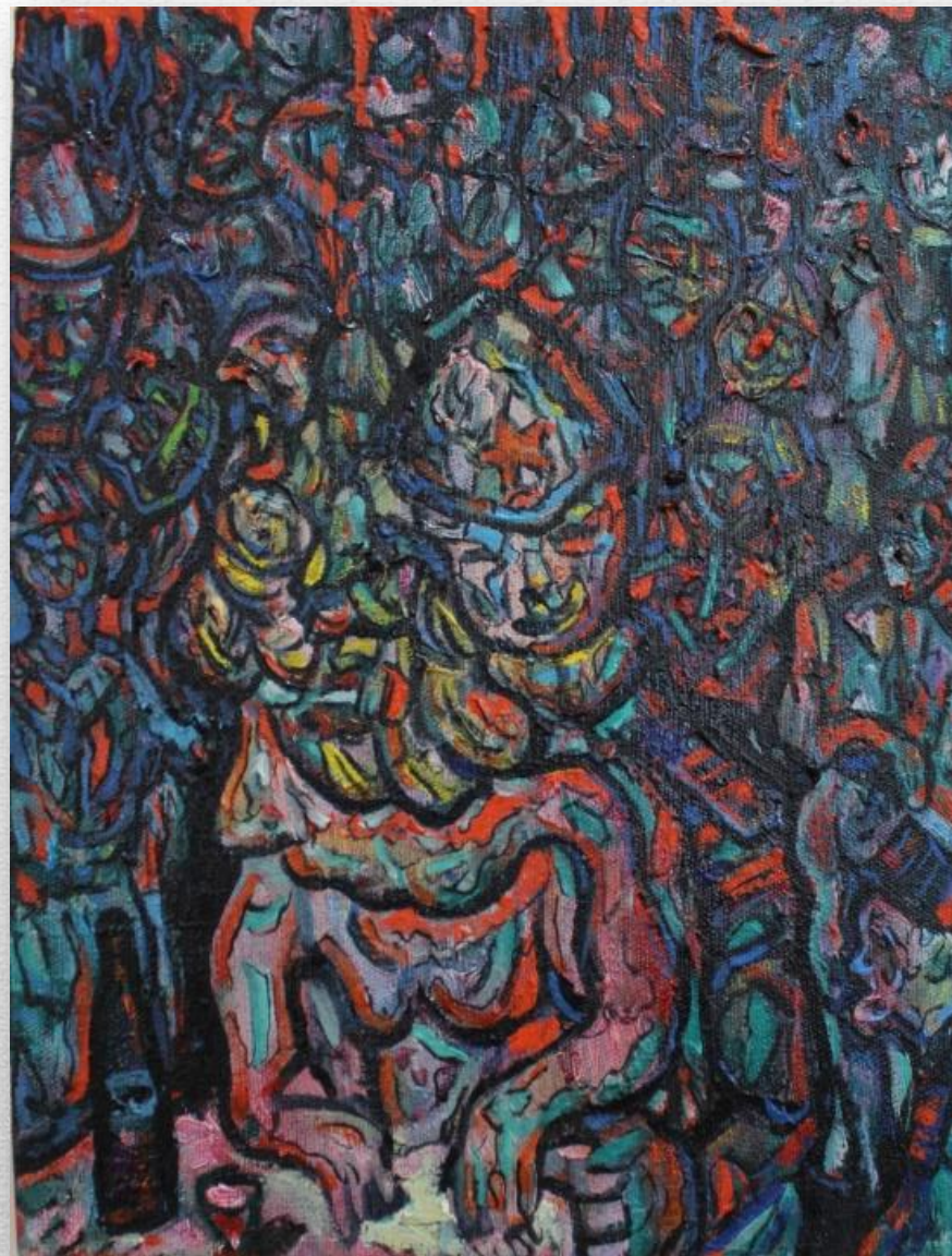
«Красная линия. Военная тематика» 2019