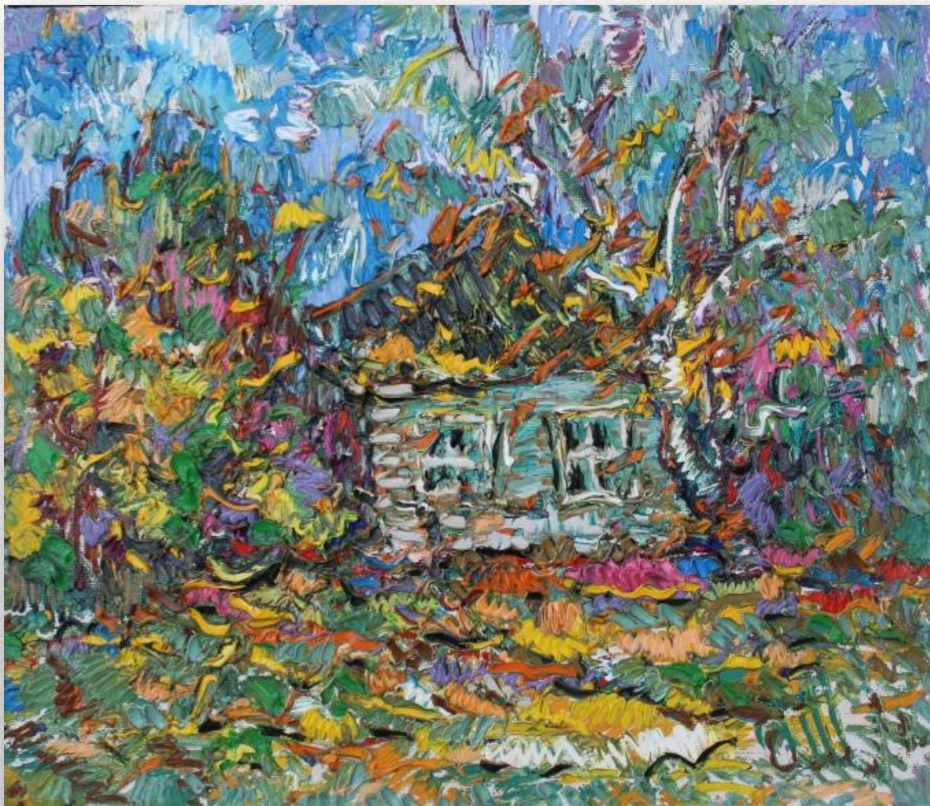
«Дом предков. Осень» 2005