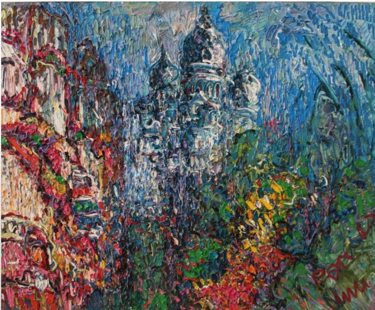
«Париж. «Сакре-Кер» 2010