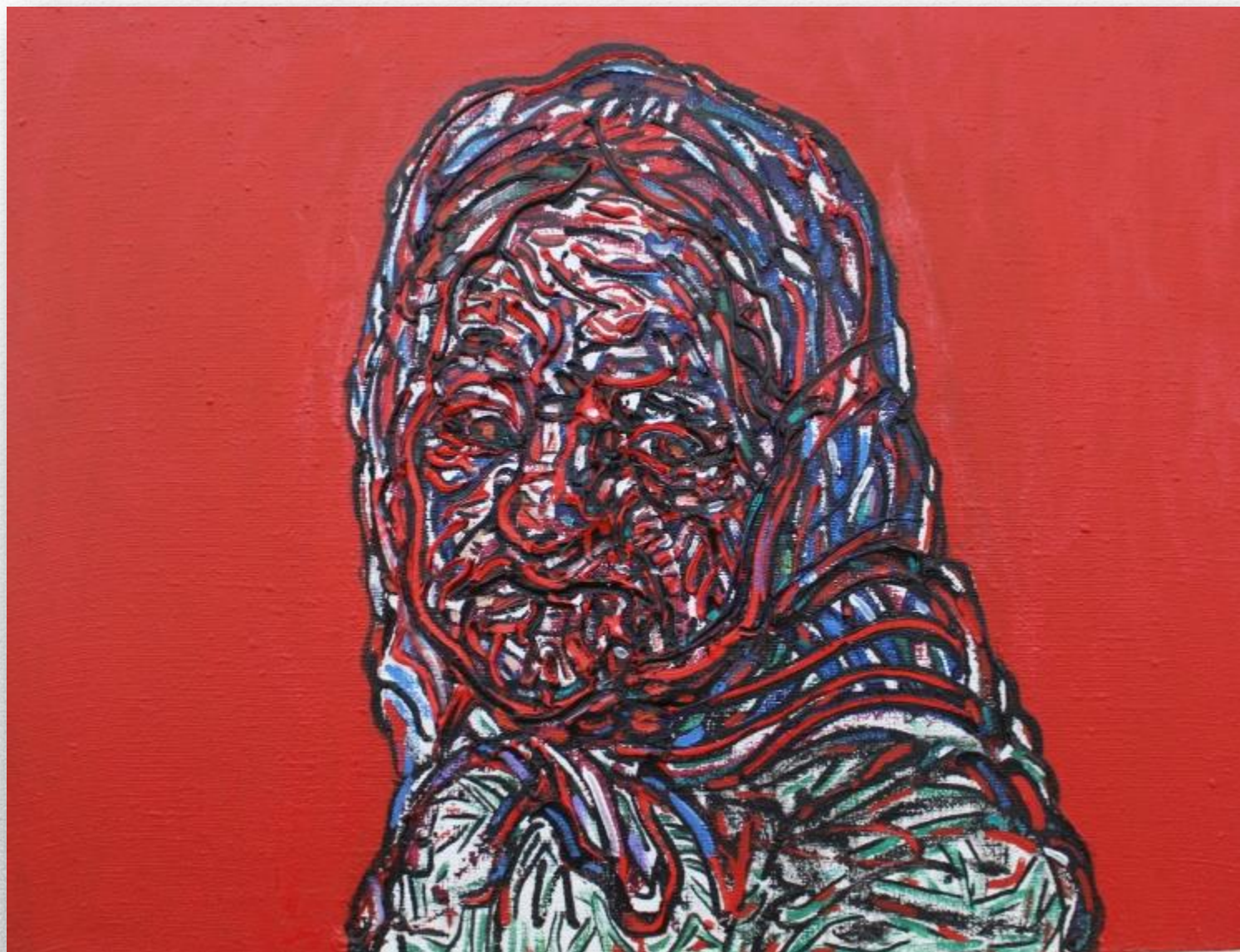
«Красная линия. Военная тематика» 2019