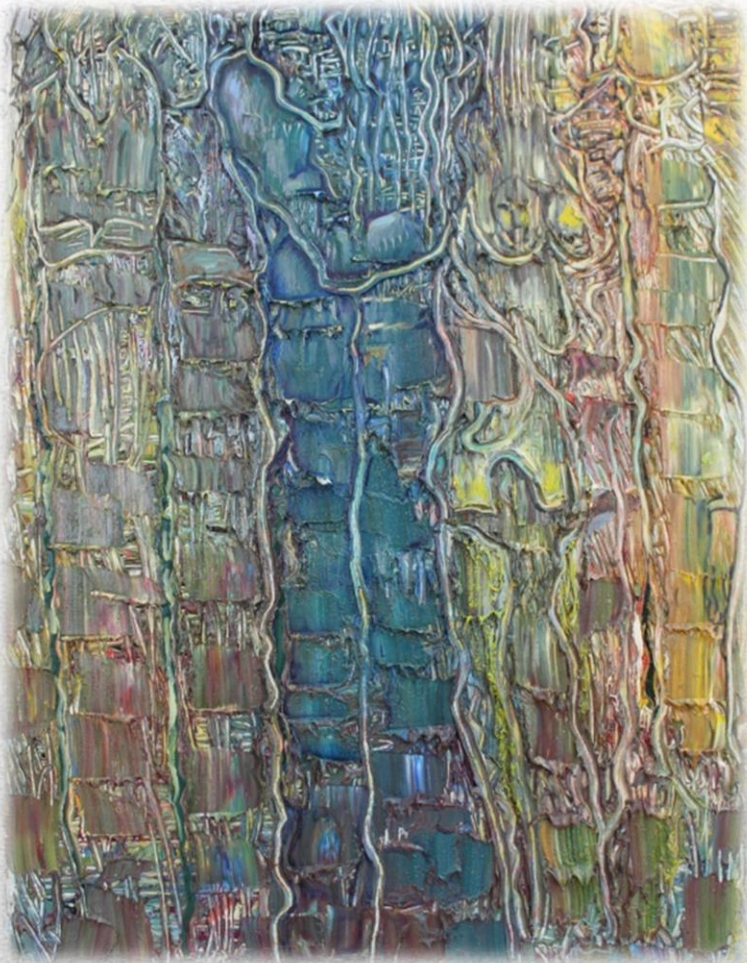
«Посвящается Врубелю «Влюбленные» 2007