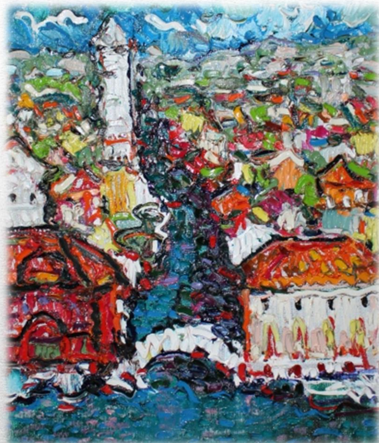
«Венеция «Мост любви» 2007