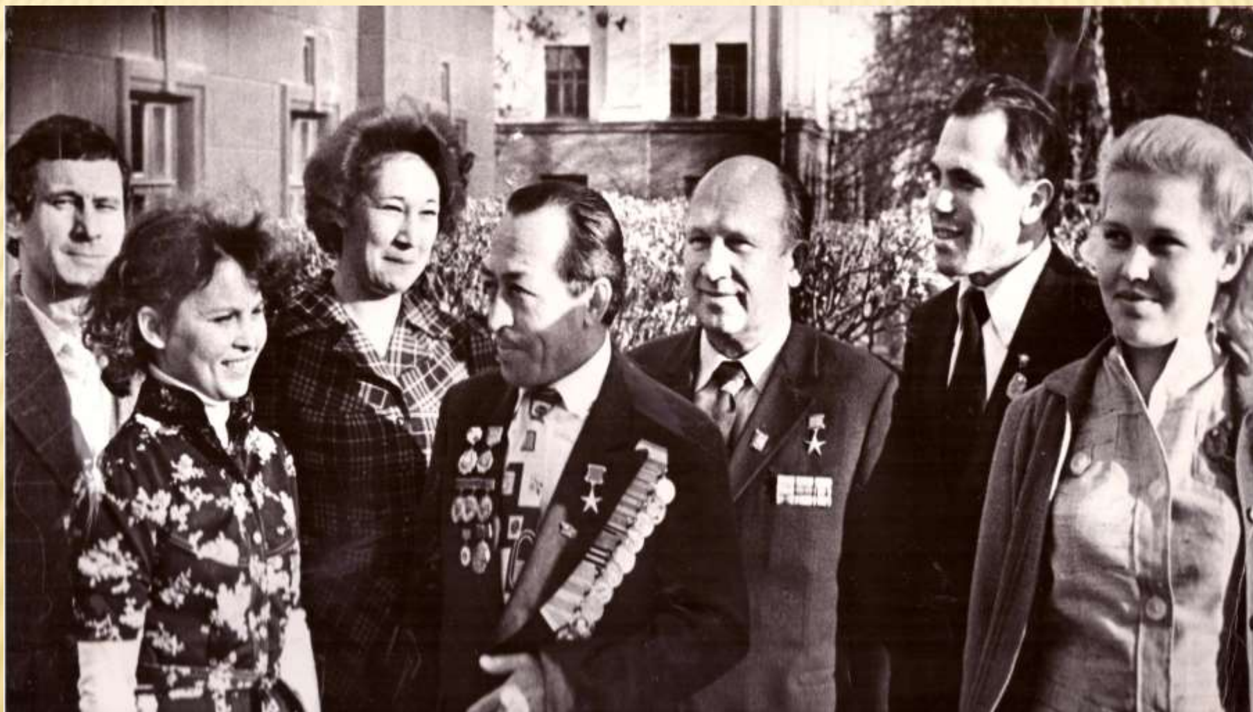
Встреча с молодыми строителями - студентами