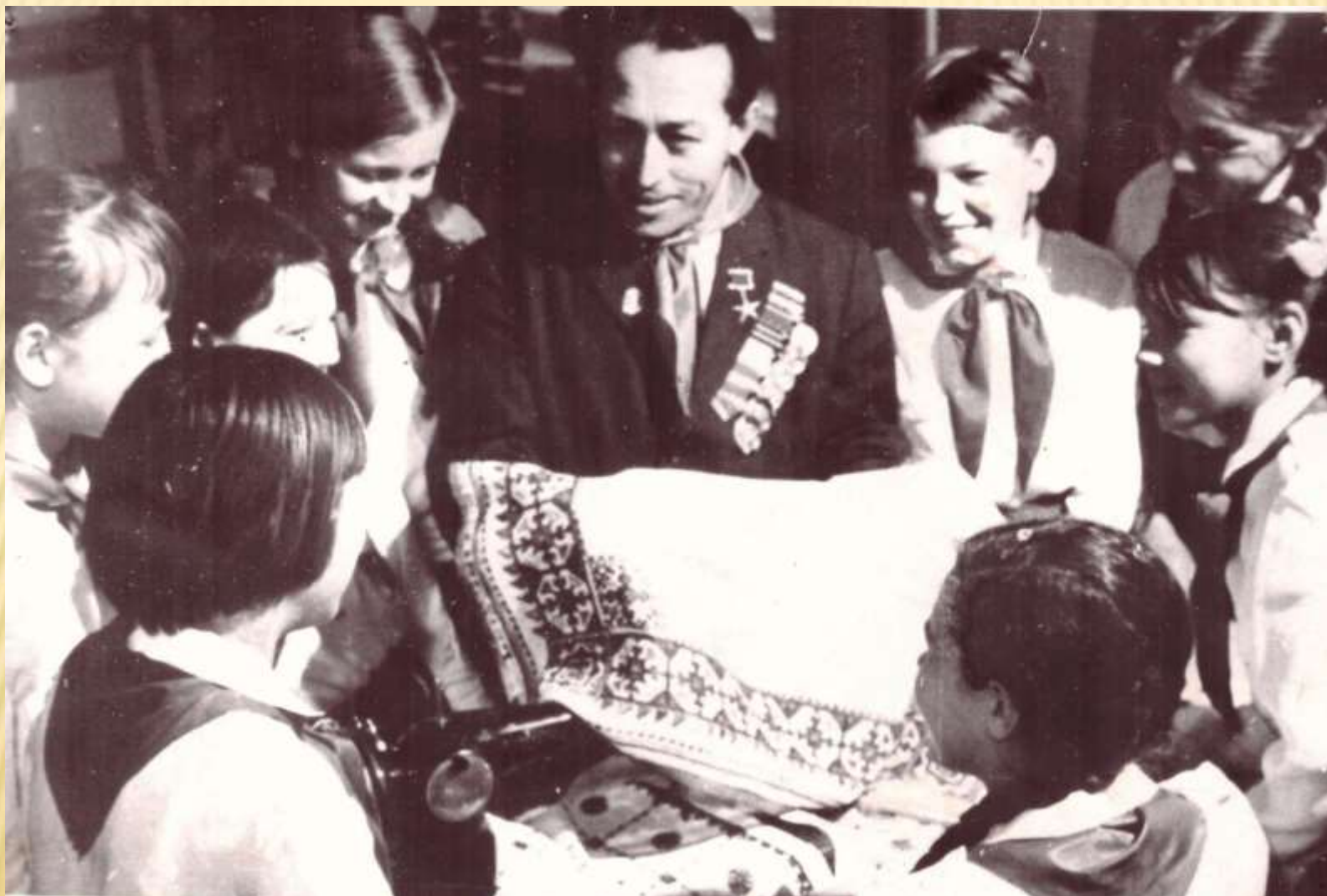
Встреча с учащимися школы