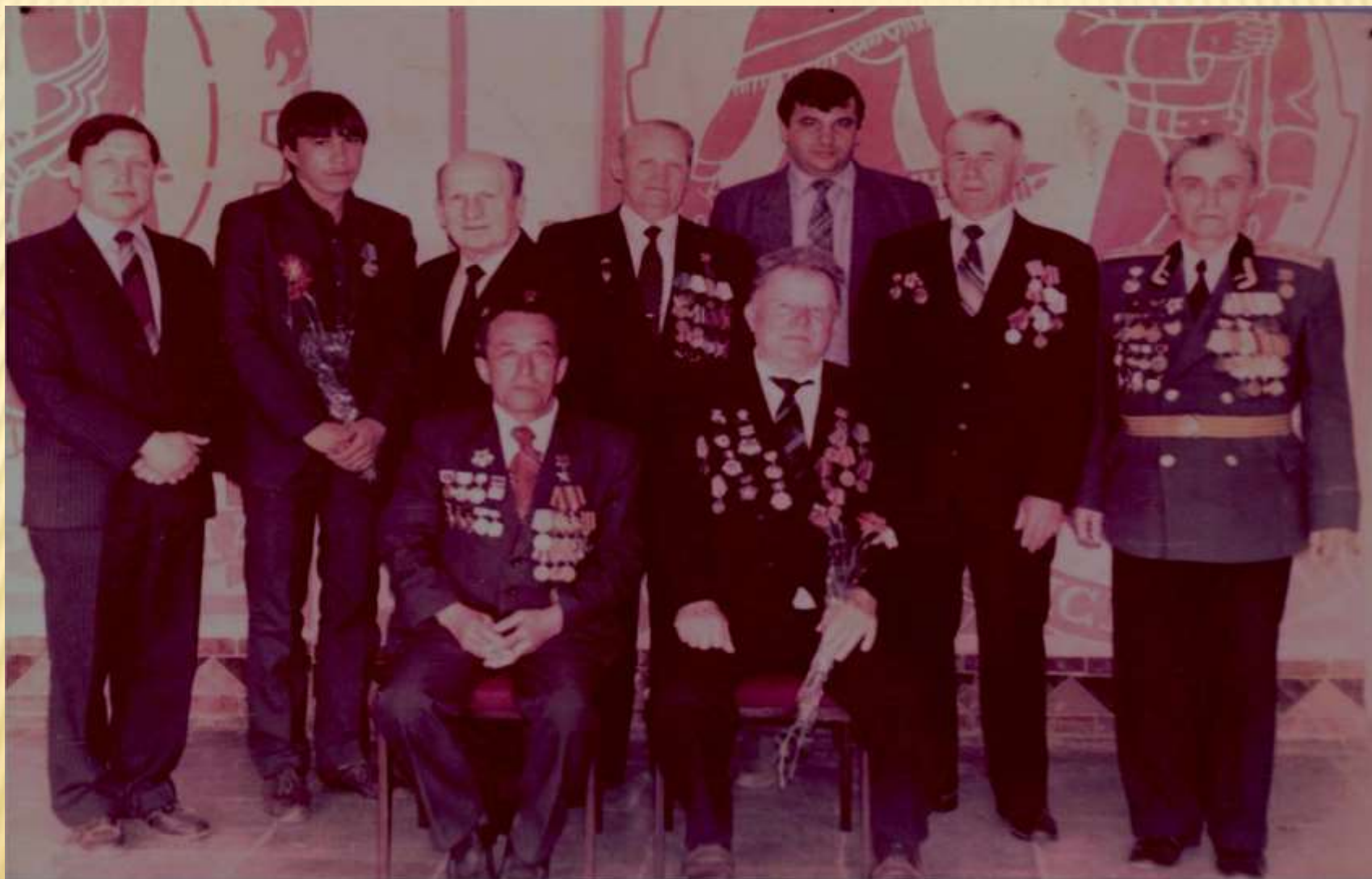
День Победы, фото на память