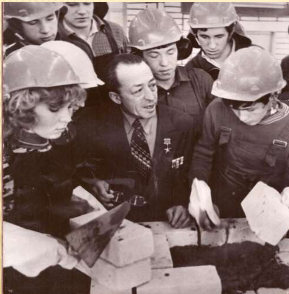
На практике с молодыми строителями - студентами