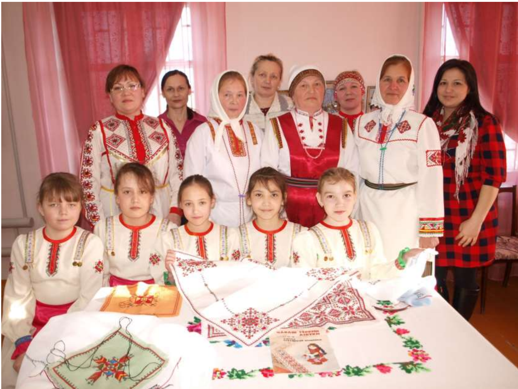
В гостях в музее – ГТРК «Чувашия»