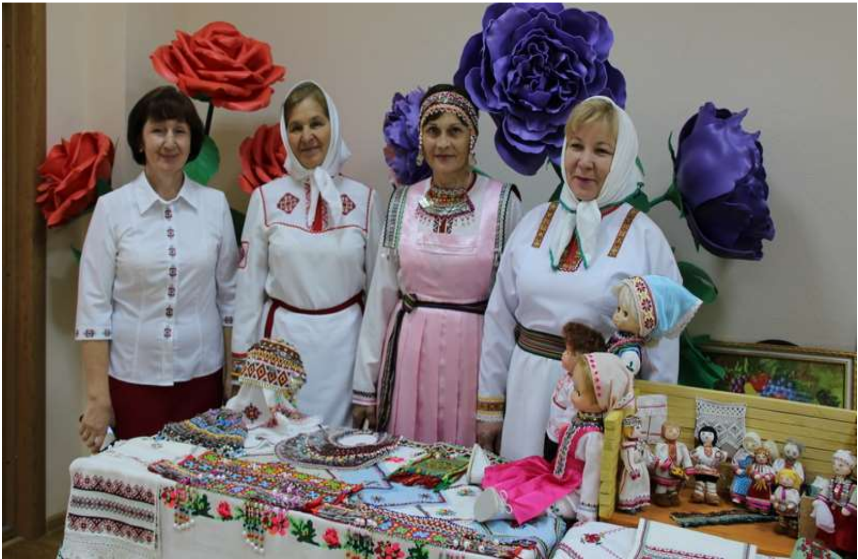
Мастерицы своего дела, самые активные члены женских советов Аликовского района.