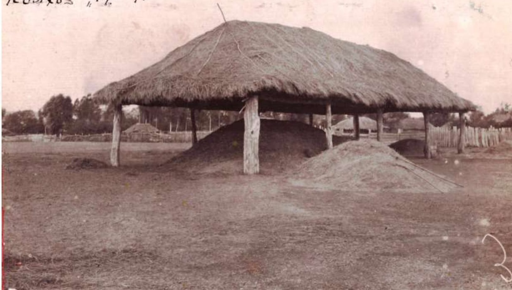
Крытый ток колхоза «Красная армия»