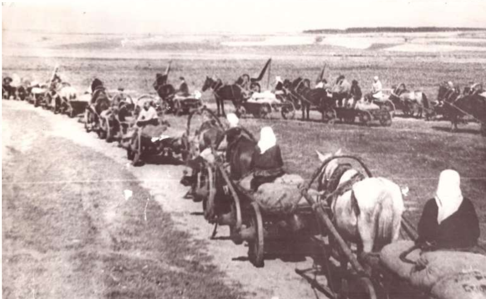
Колхозники Аликовского района. Красный обоз для сдачи хлеба государству.