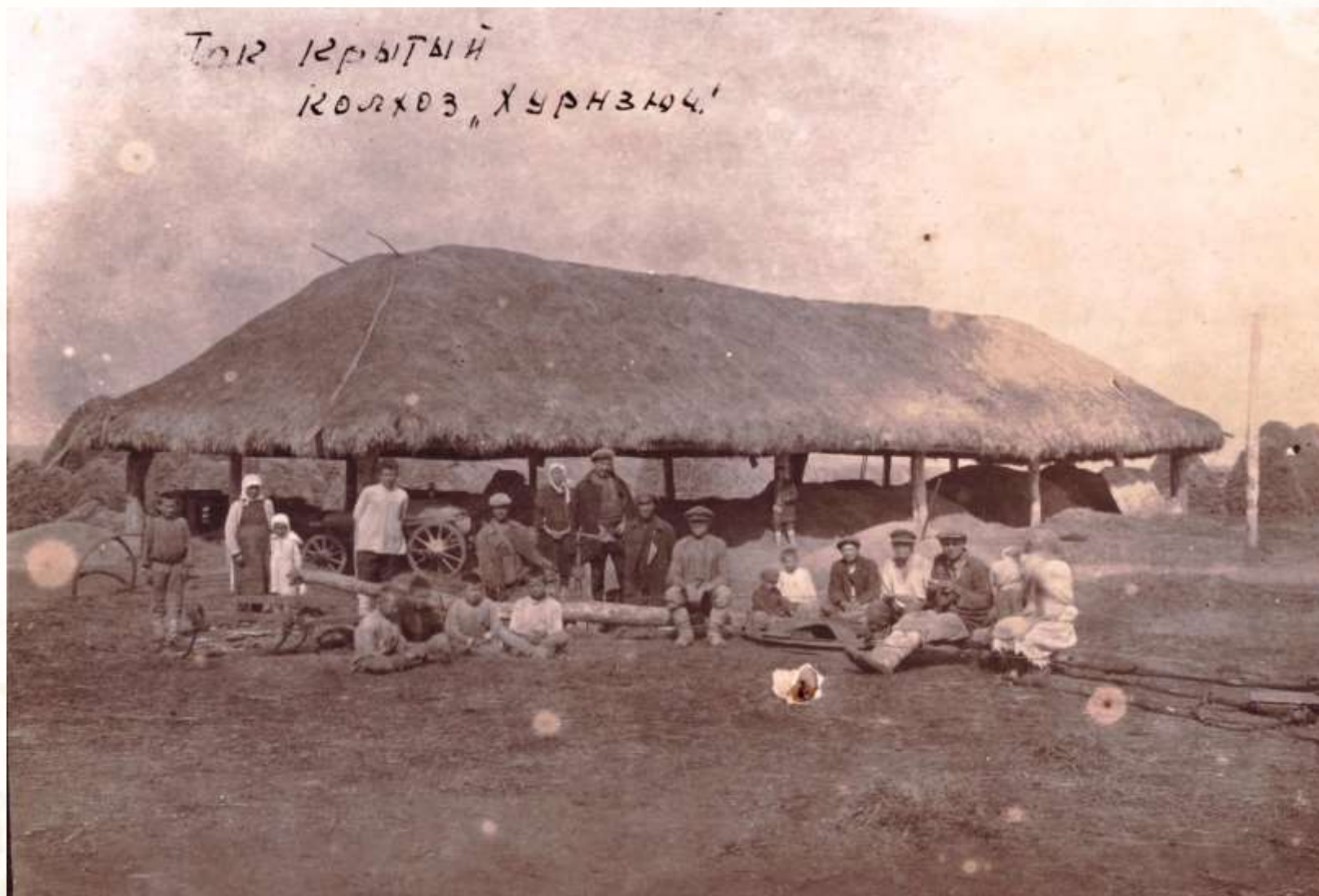
Крытый ток колхоза «Хурнсюч»