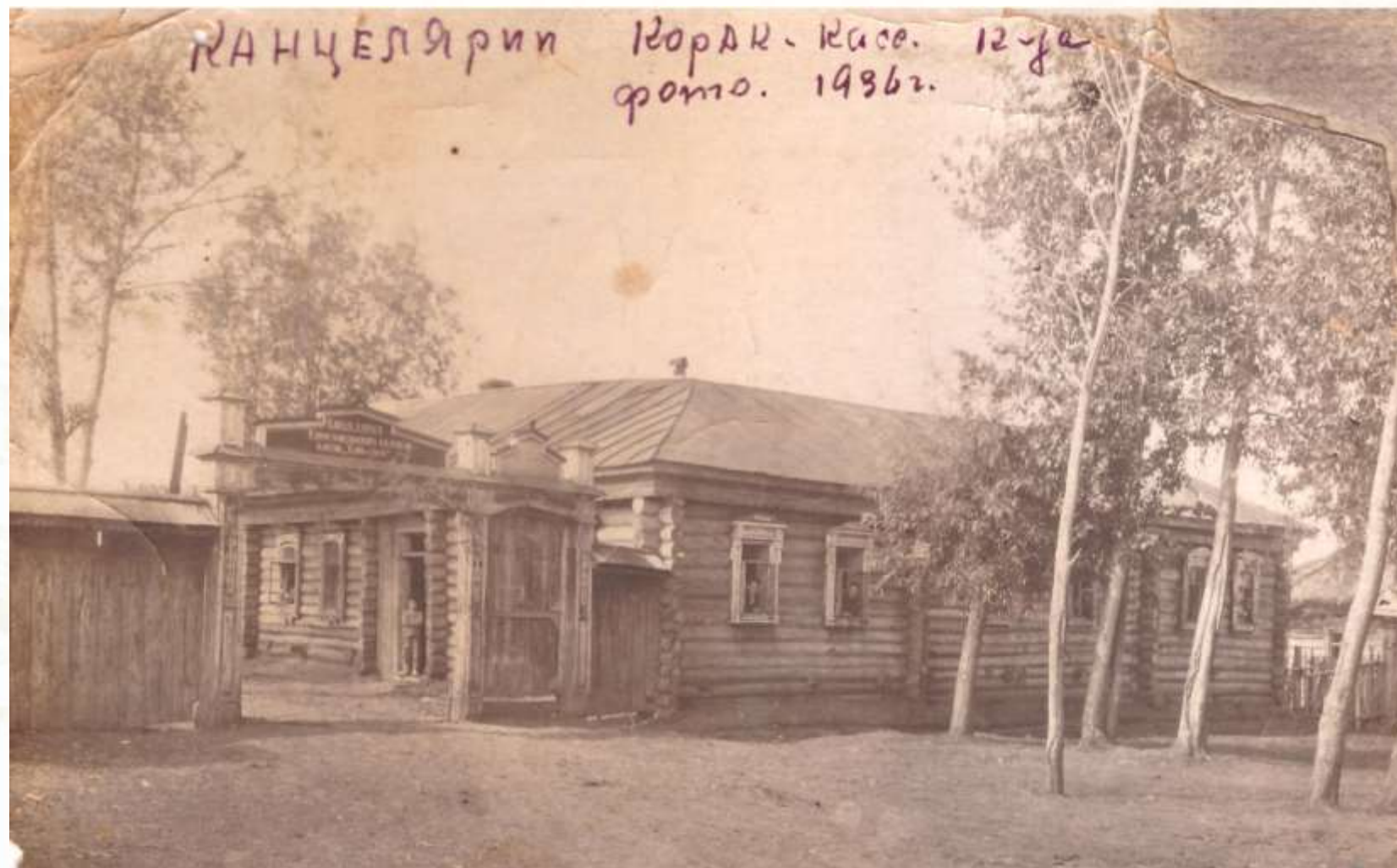
Канцелярия Коракасинского колхоза. 1936 г.