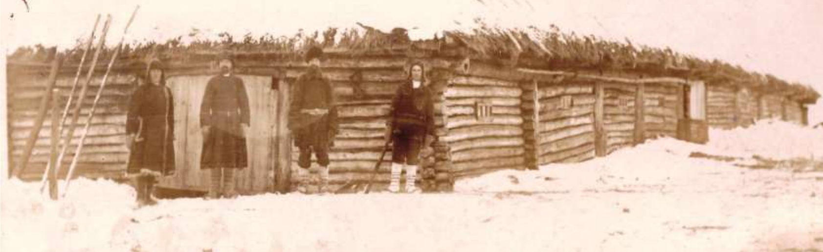
Конюшня колхоза «Большевик»