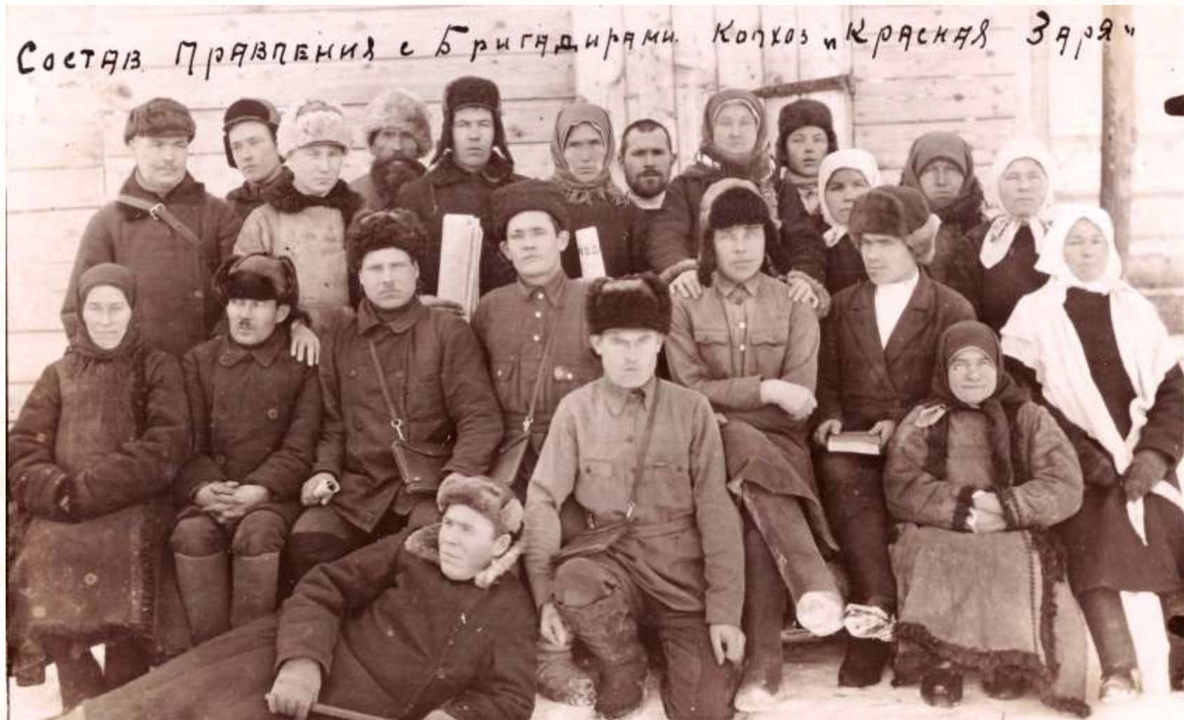
Состав правления с бригадирами колхоза «Красная Заря»