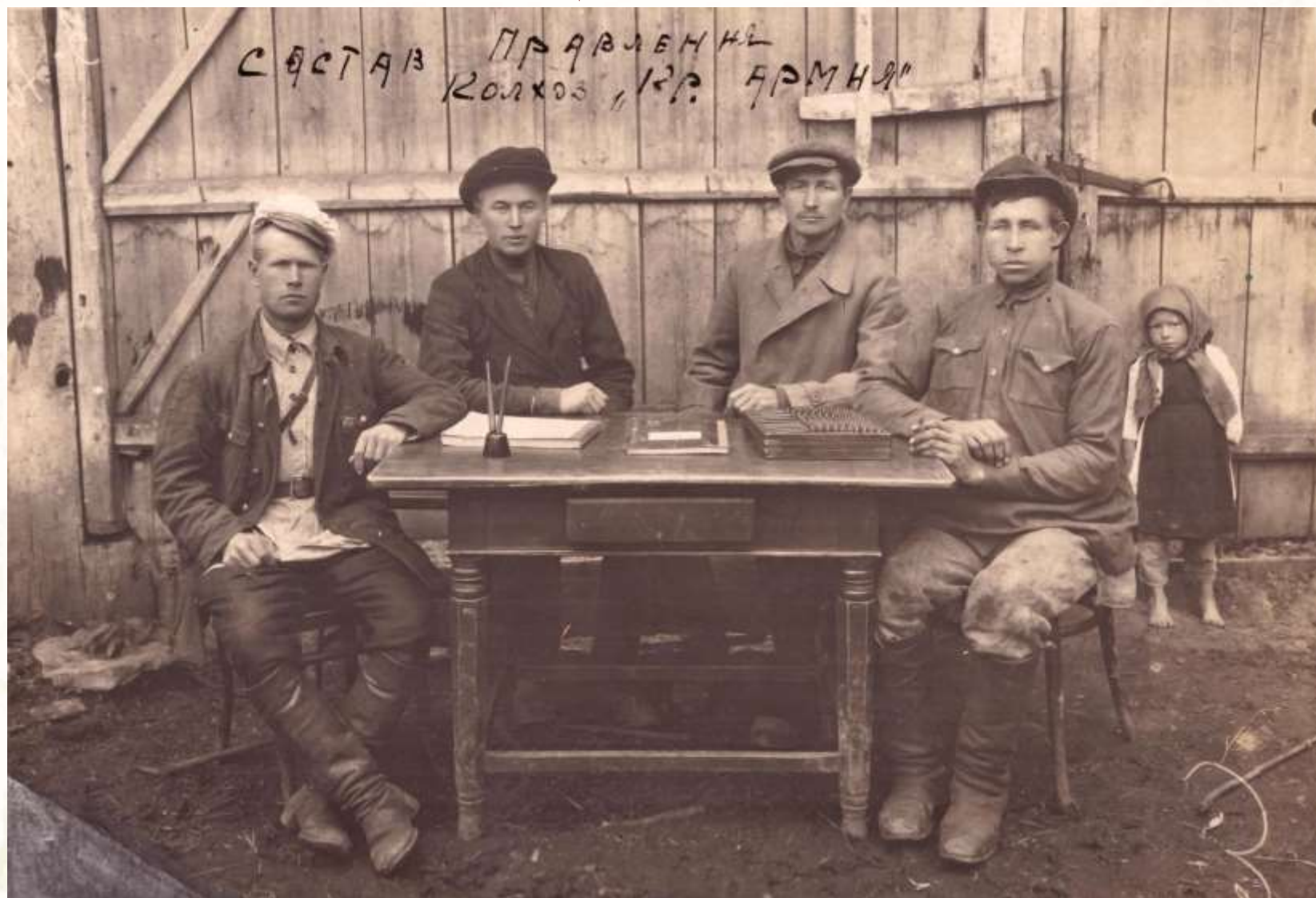
Состав правления колхоза «Красная Армия»