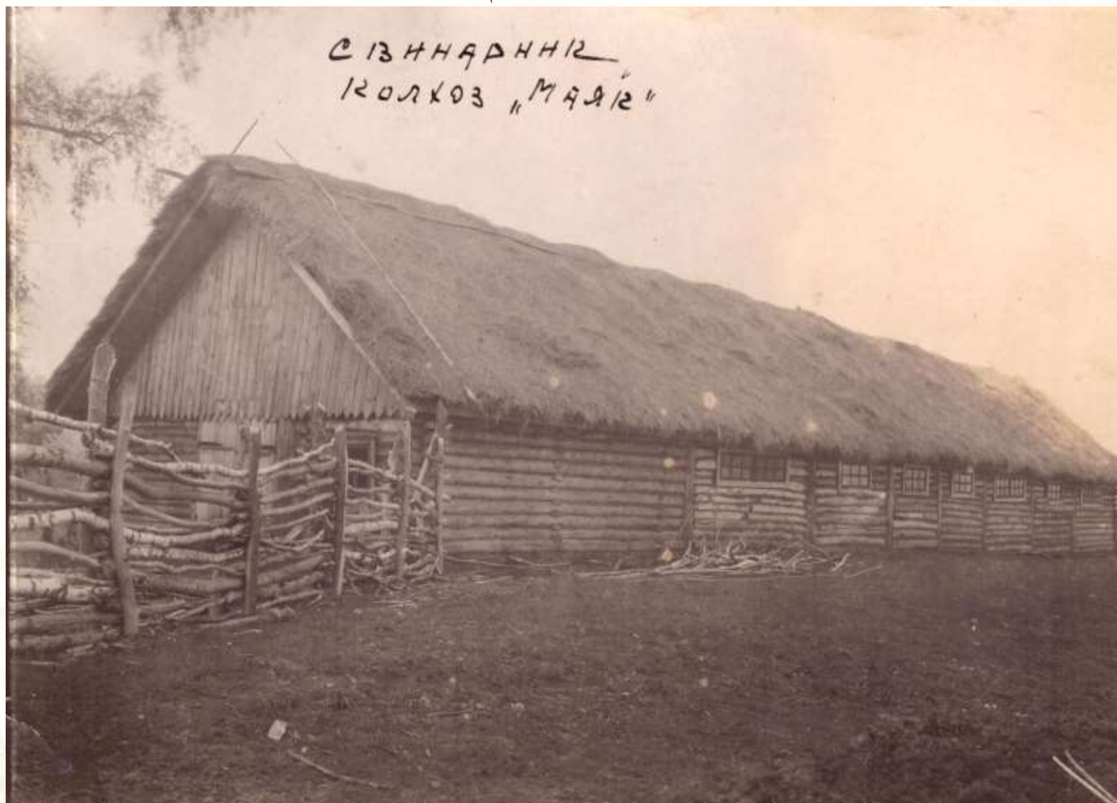
Свинарник колхоза «Маяк»