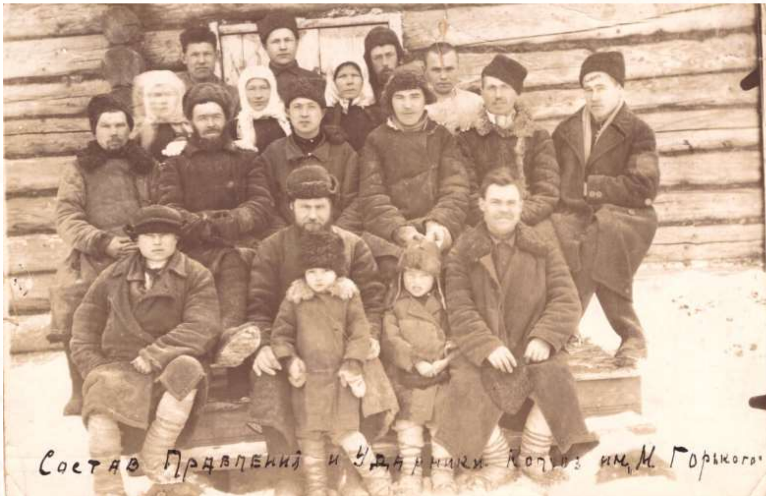
Состав Правлений и Ударники Колхоз им. М. Горького

Состав правления и ударники колхоза им. М. Горького