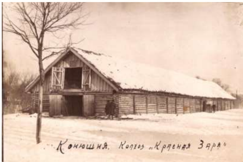
Конюшня. Колхоз «Крестьянская Заря»