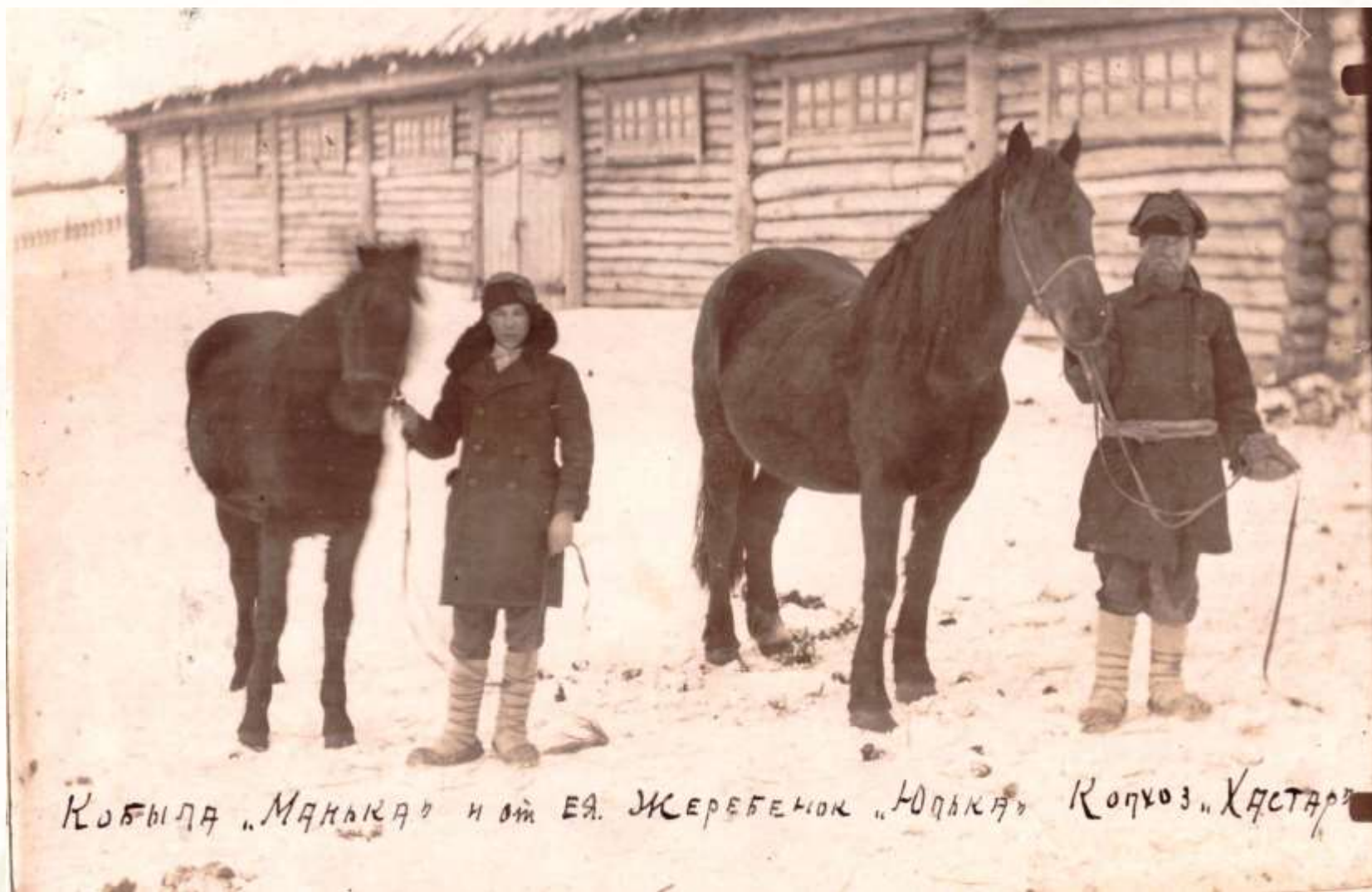
Кобыла Манька и жеребенок Юлька колхоза «Хастар»