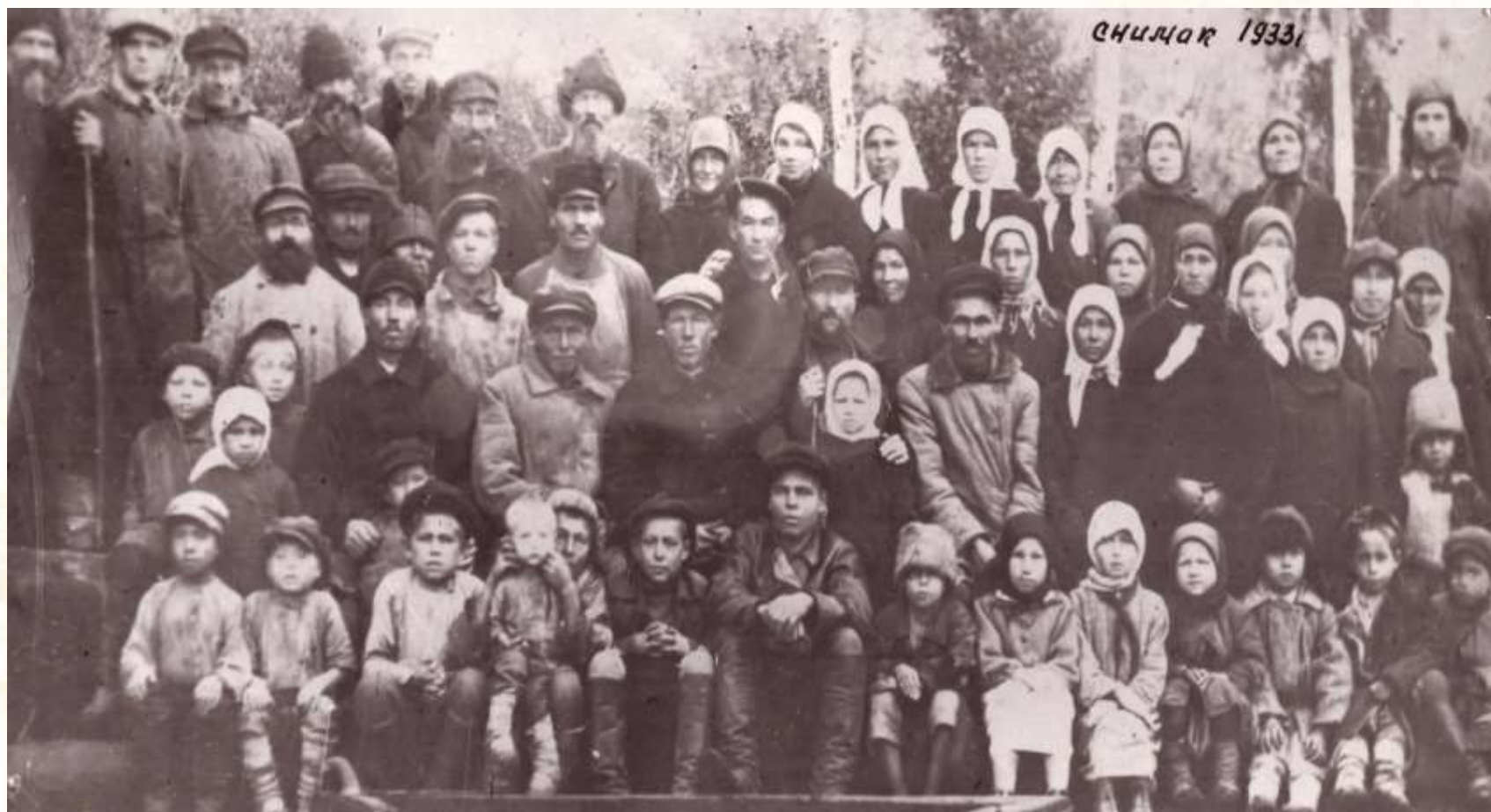
Первые колхозники, колхозницы и дети колхоза имени Жданова (д. Синерь), 1933 г .