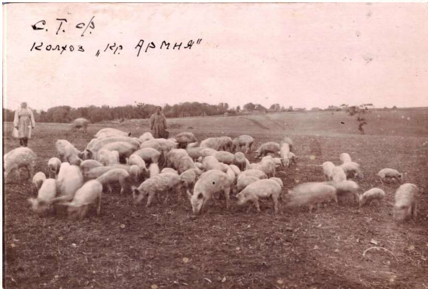
Свинотоварная ферма колхоза «Красная Армия»