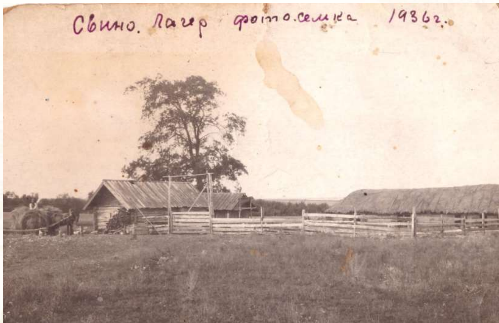
Свиной лагерь. 1936 г.