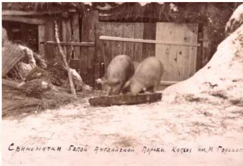
Свиноматки белой английской породы. Колхоз им. М. Горького