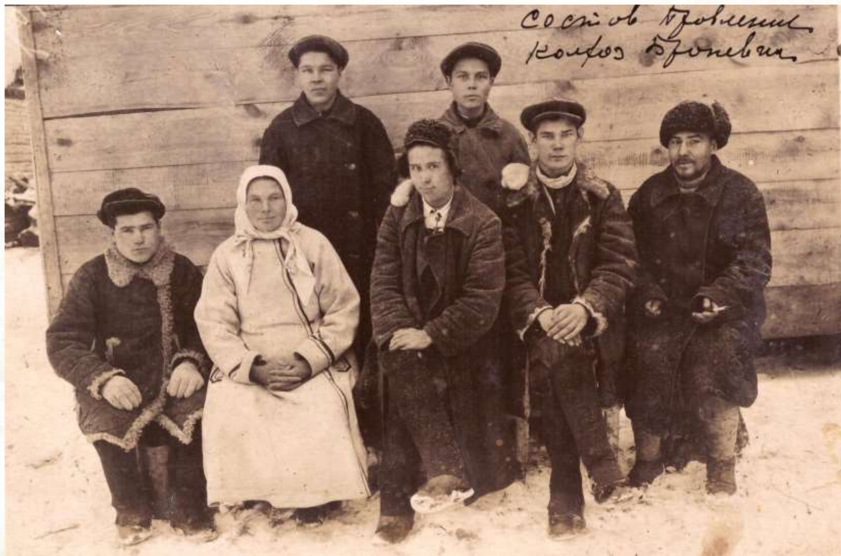
Состав правления колхоза «Броневик»