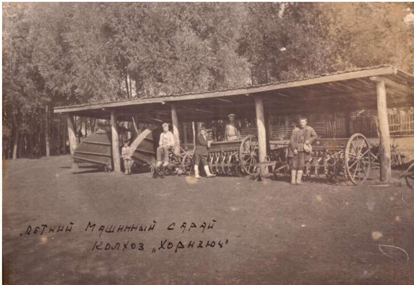
Машинный сарай колхоза «Хорнсюч»