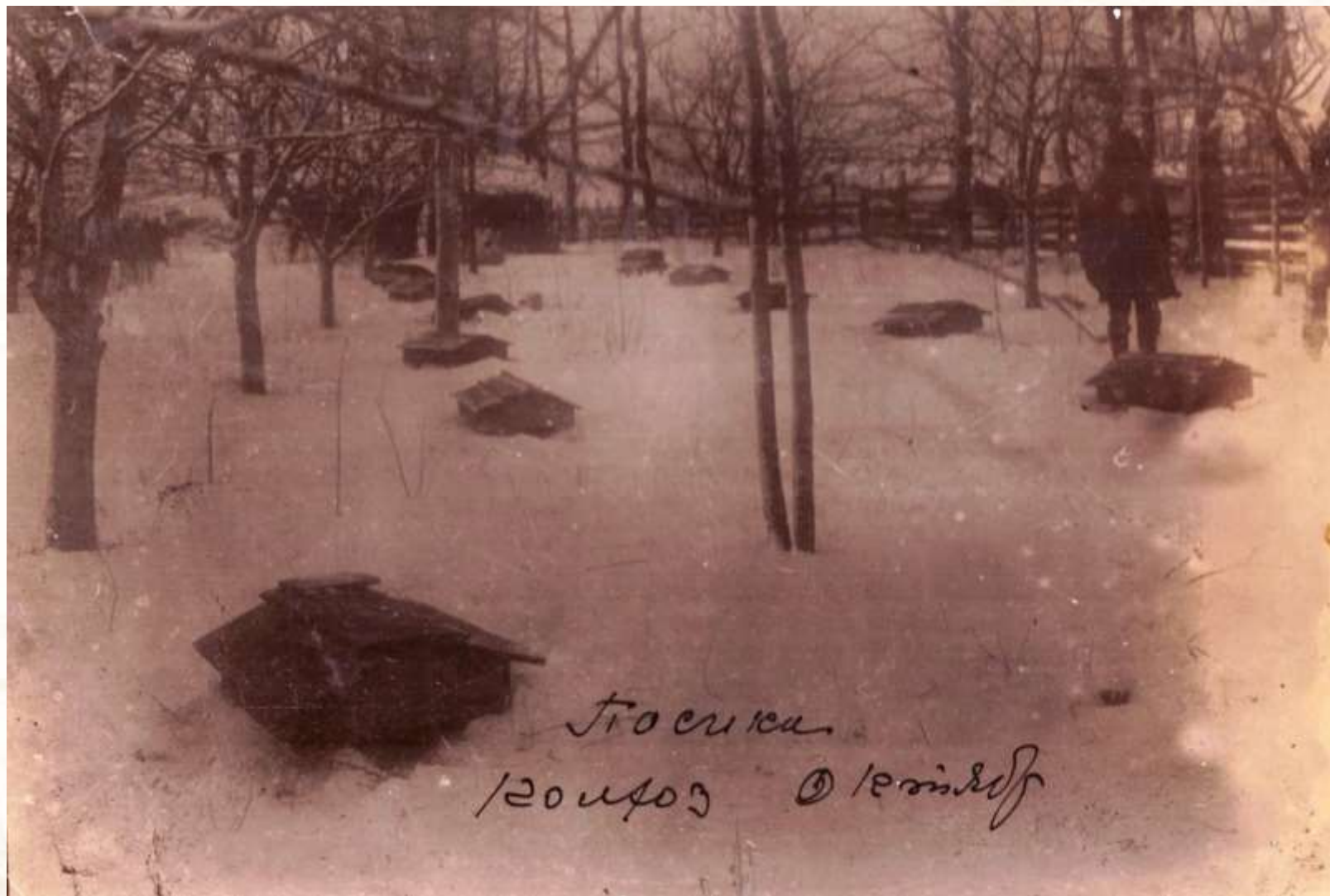
Посадка колхоза «Октябрь»