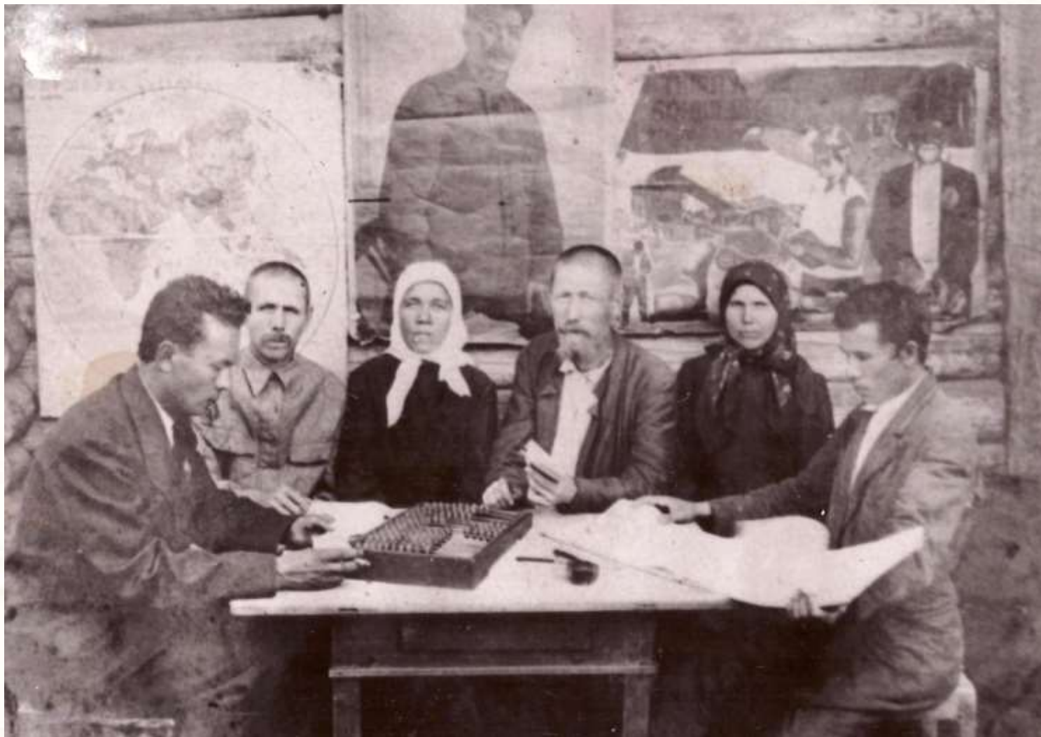
Состав правления колхоза «Новый путь», дер. Ходяково.