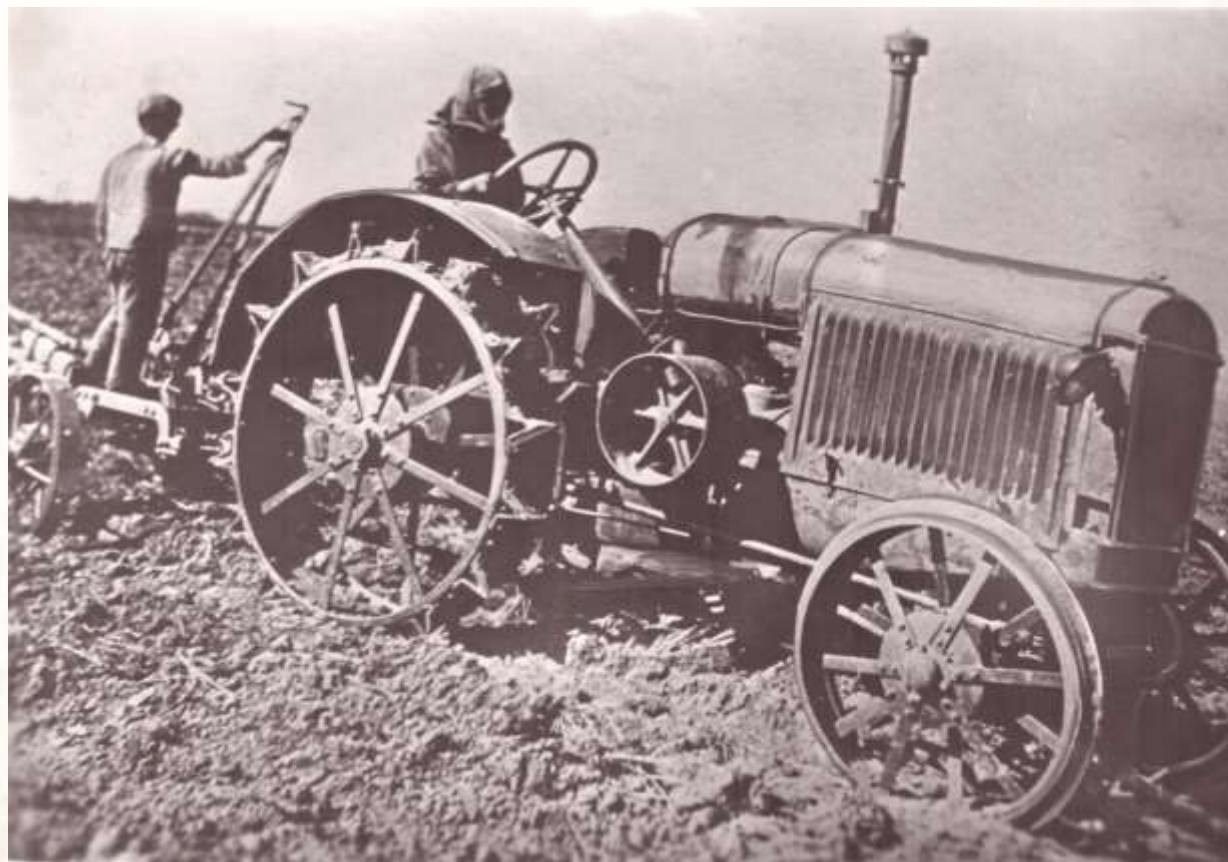
На колхозном поле Евдокия Шлябина (д. Изванкино)