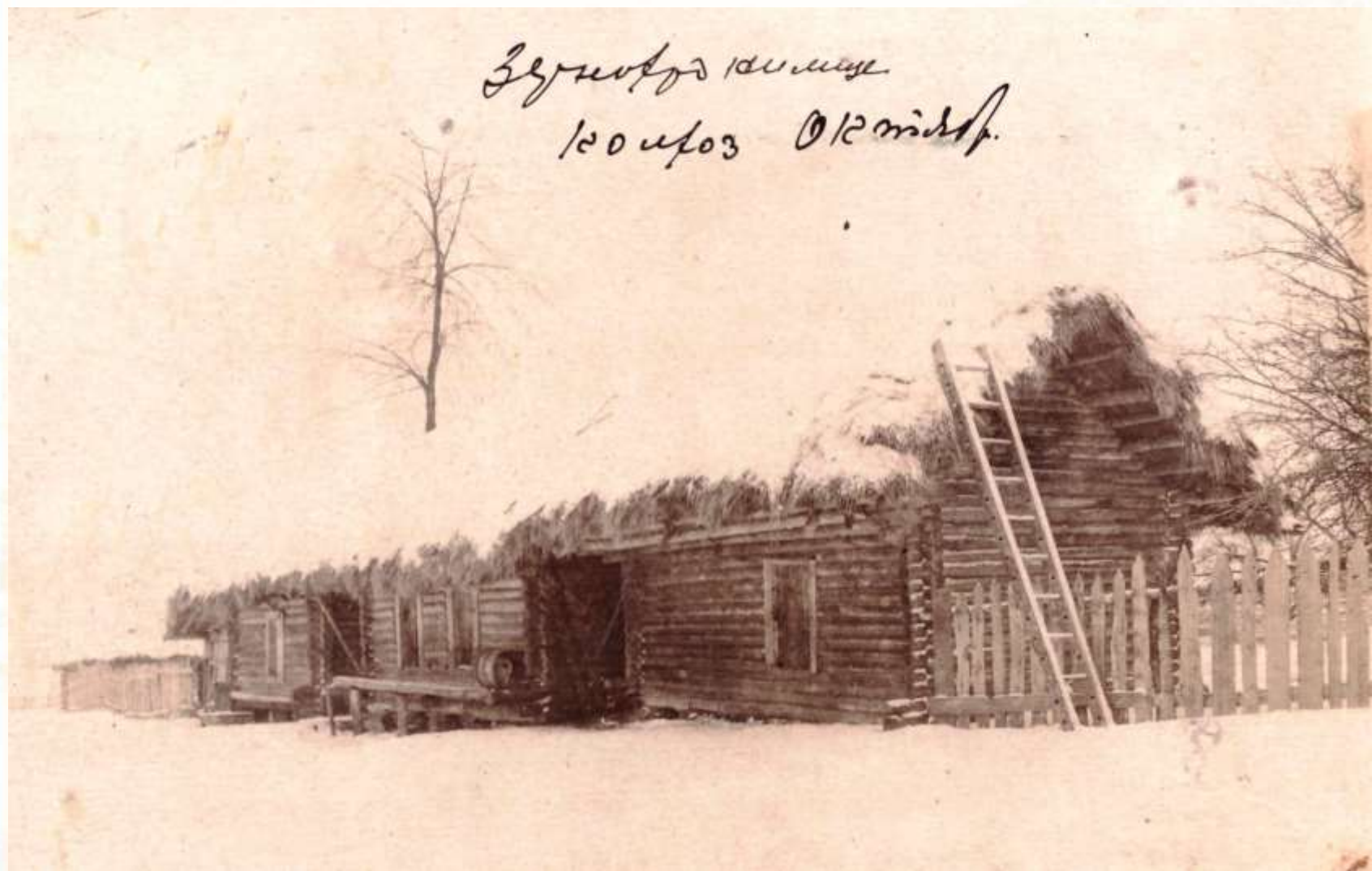
Зернохранилище колхоза «Октябрь»