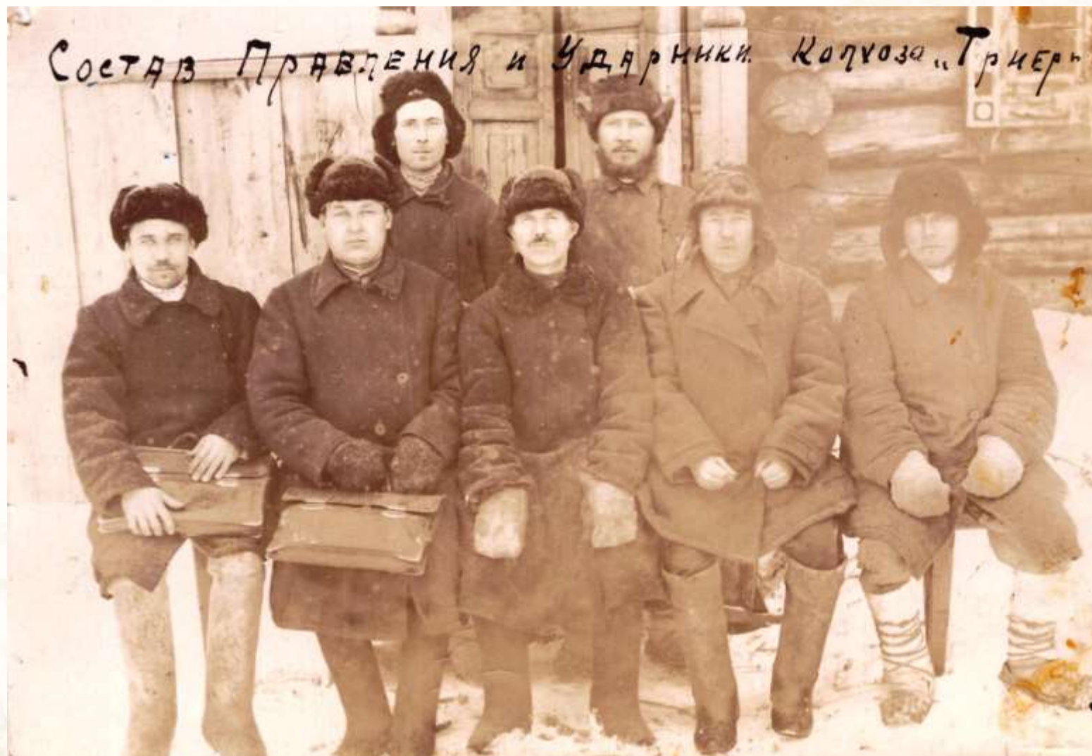
Состав правления и ударники колхоза «Триер»