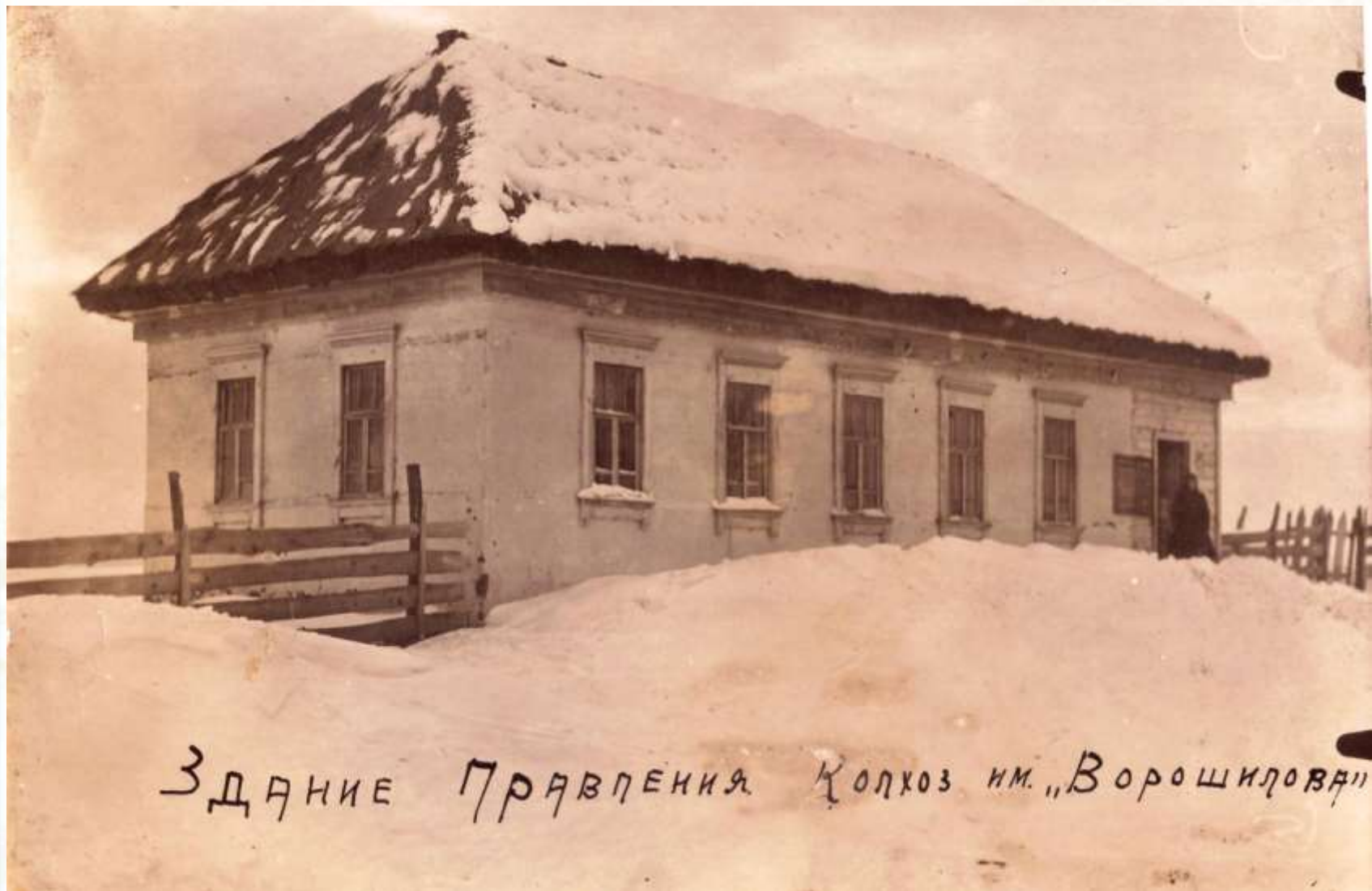
Здание правления колхоза имени Ворошилова