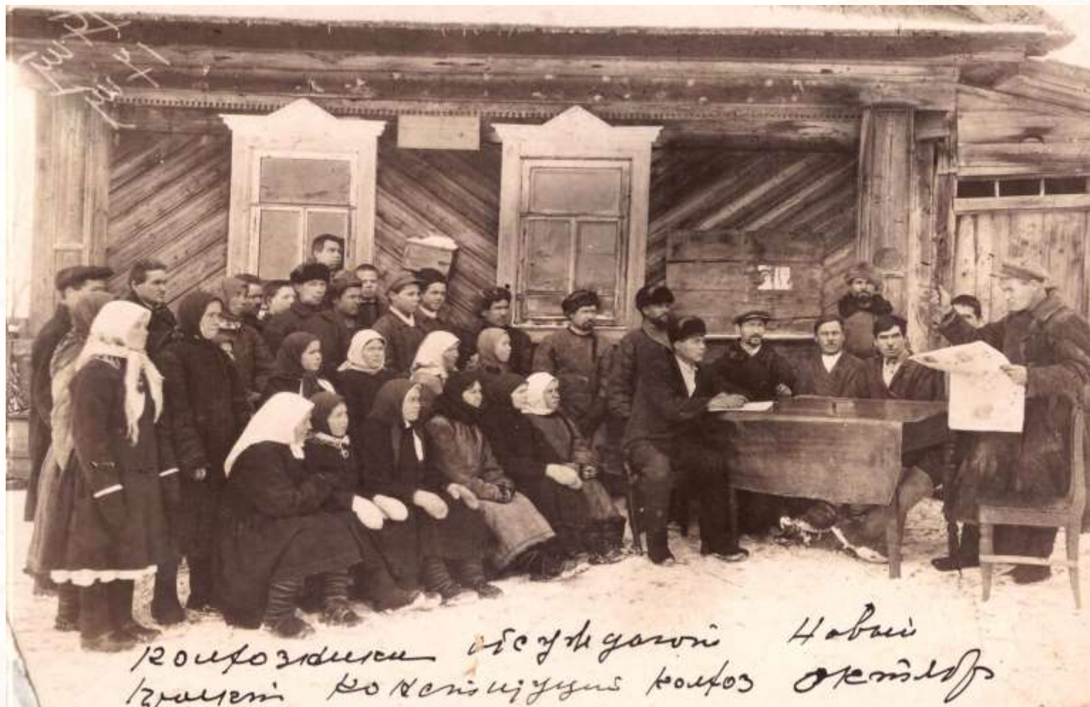
Колхозники обсуждают новый проект Конституции. Колхоз «Октябрь».