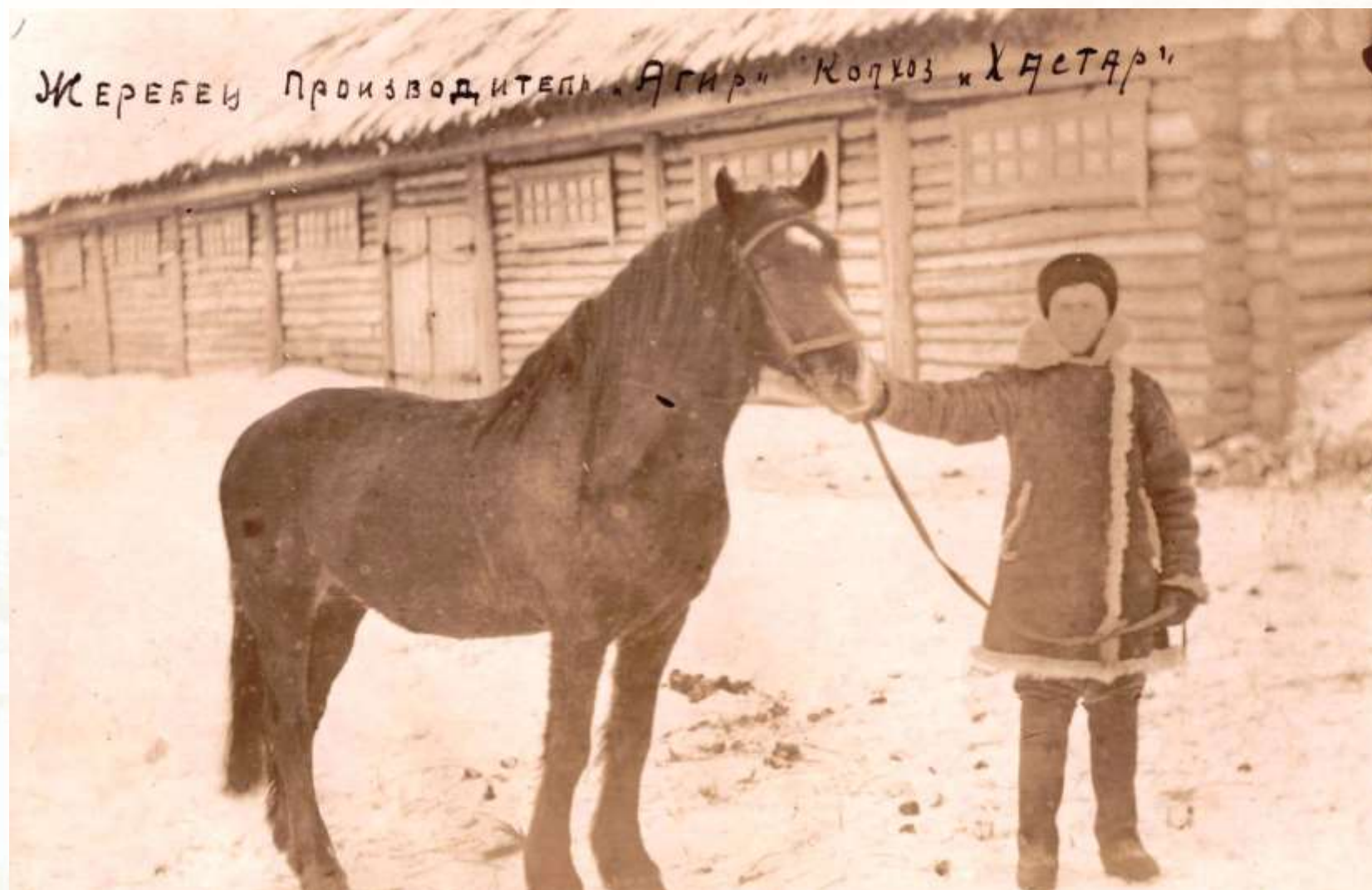
Жеребец – производитель Агир колхоза «Хастар»