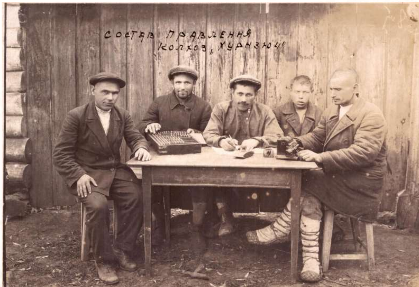
Состав правления колхоза «Хорнсюч»