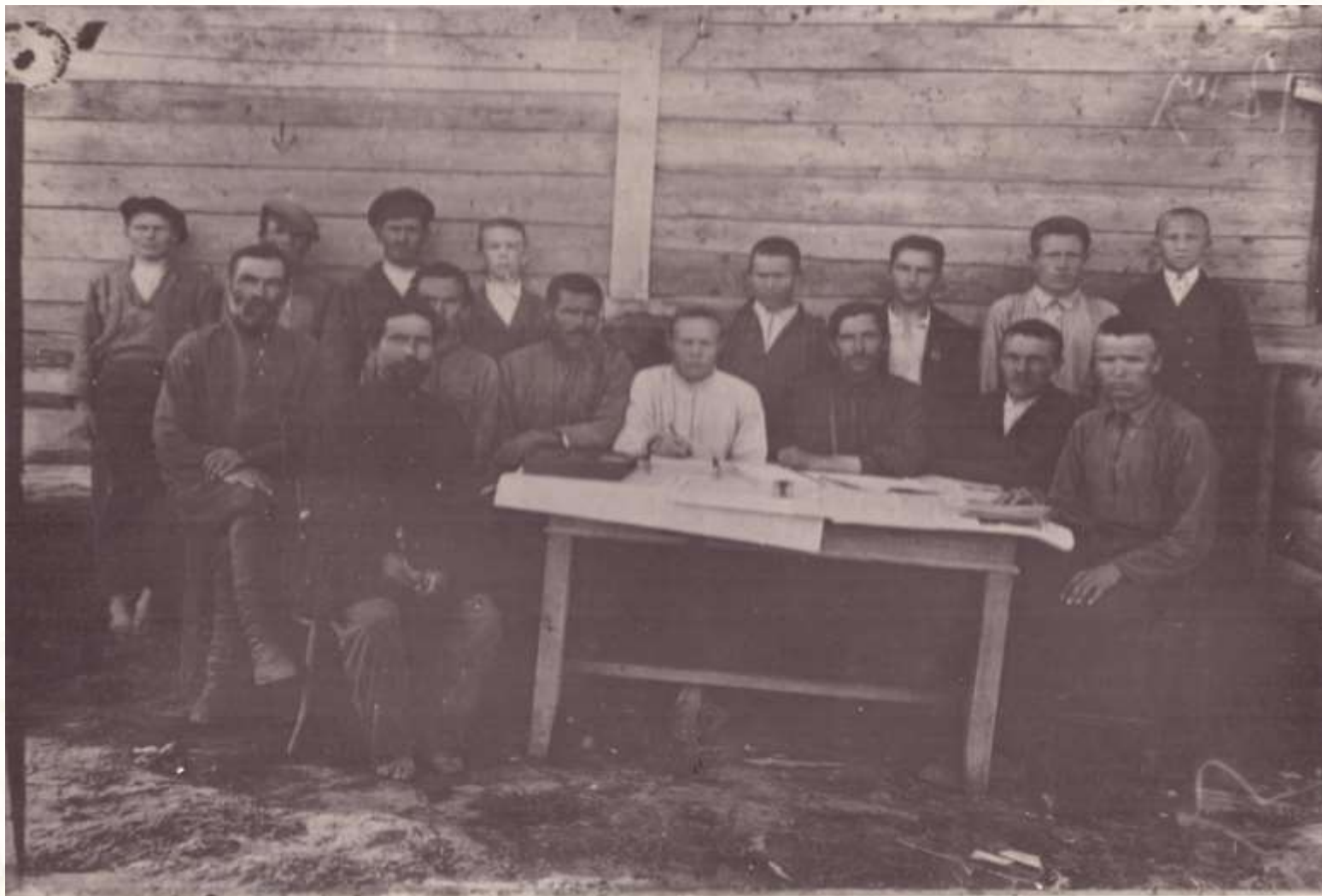
Состав правления колхоза «Сталинец» дер. Таурово