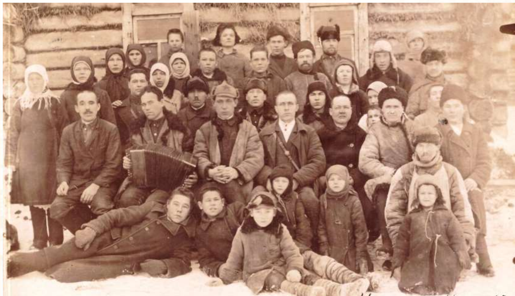
Состав Правления с Ударниками и Членами Колхоза. Колхоз им. "Ворошилова"

Состав правления с ударниками и членами колхоза имени Ворошилова