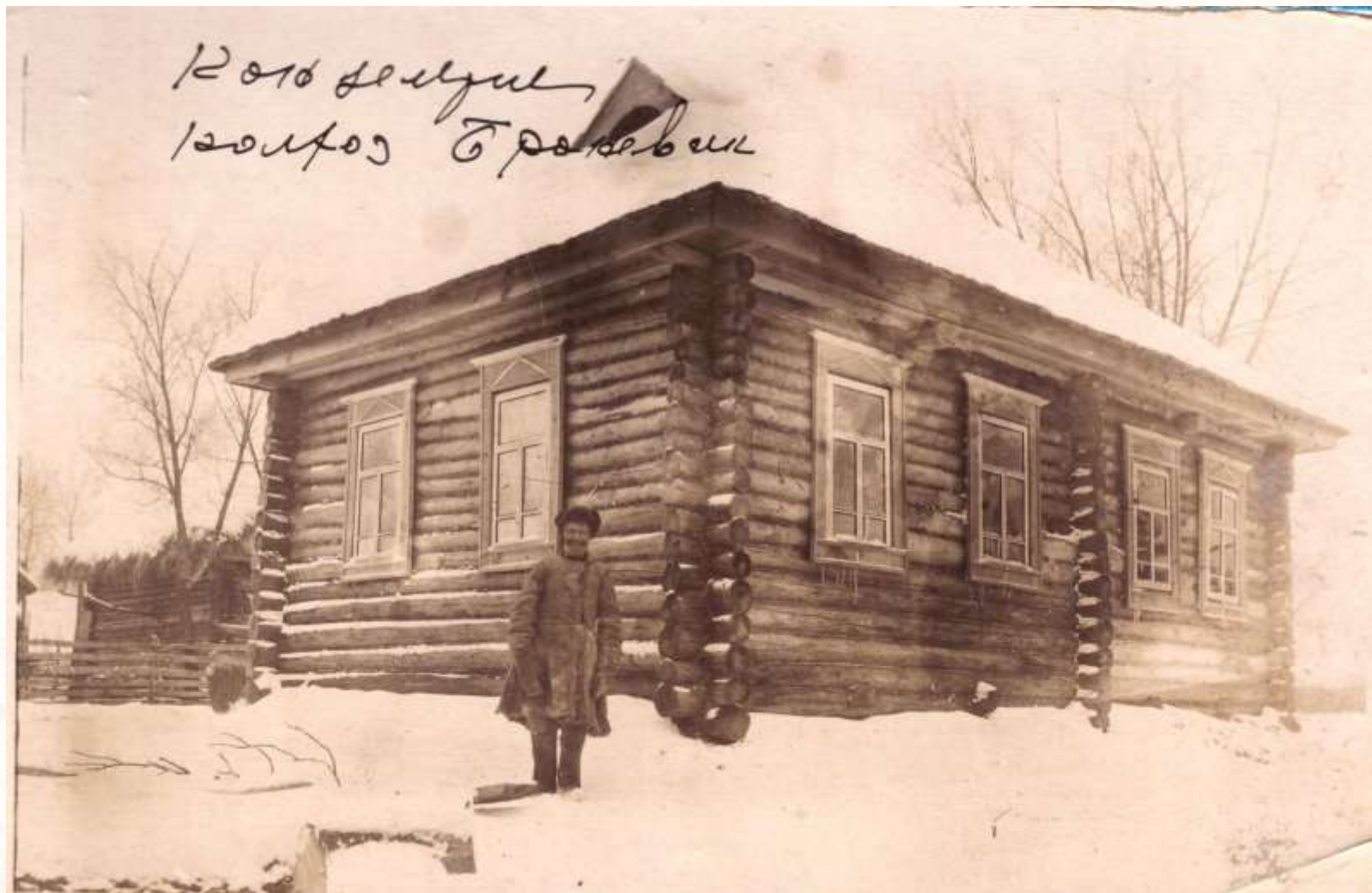
Канцелярия колхоза «Броневи́к»