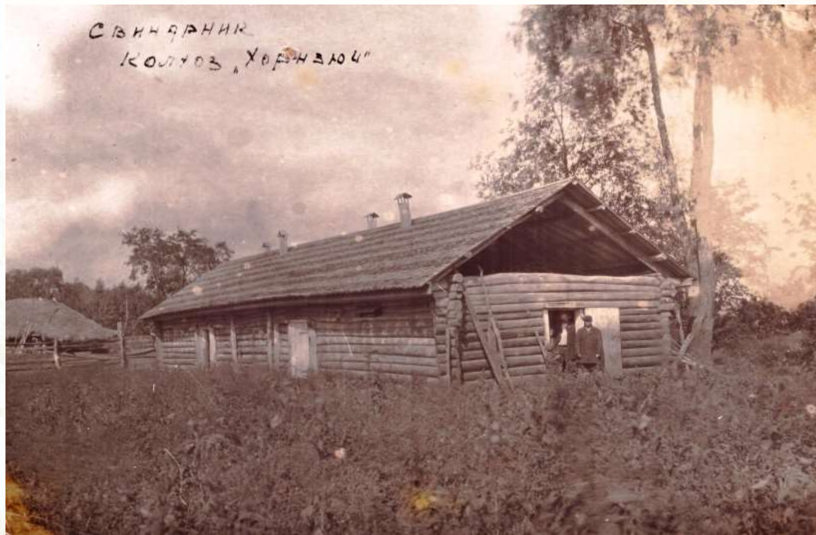
Свинарник колхоза «Хорнсюч»