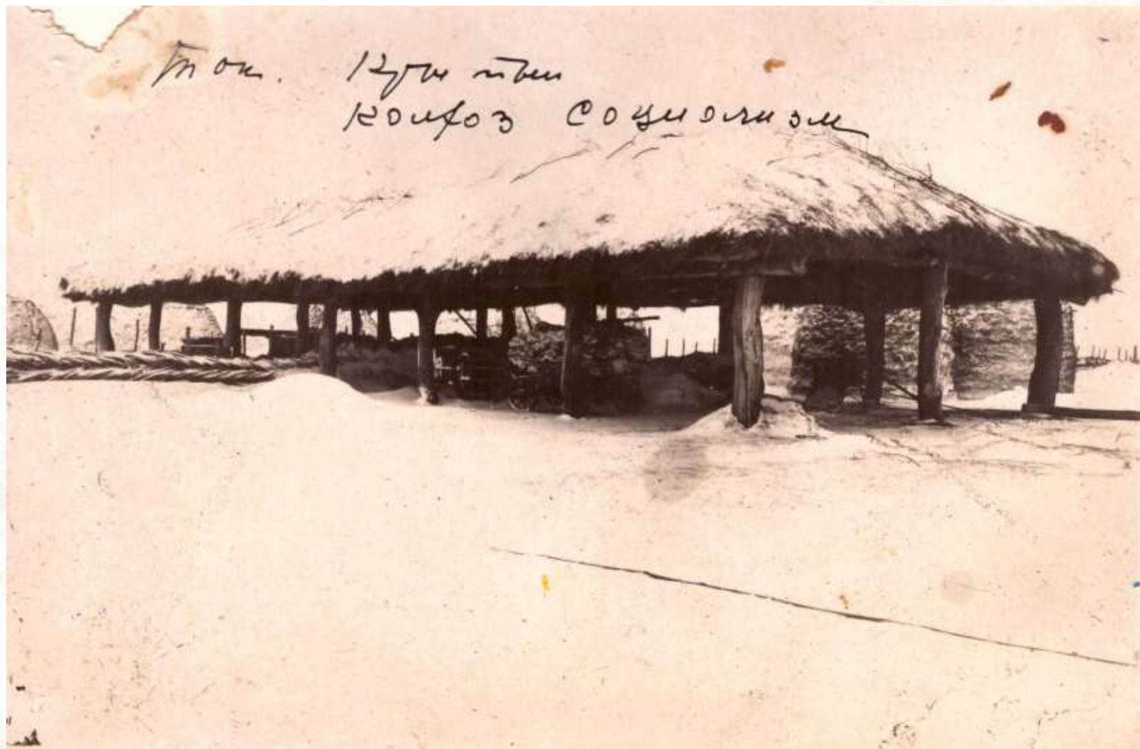
Крытый ток колхоза «Социализм»