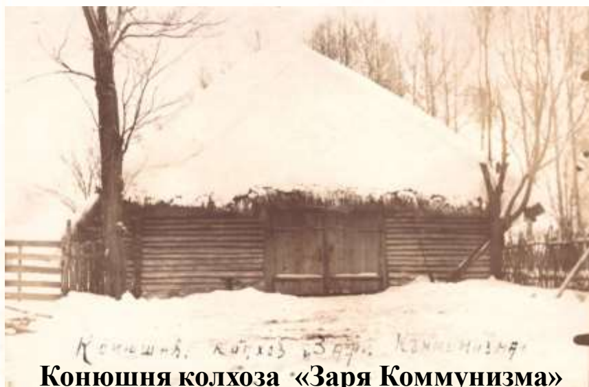
Конюшня колхоза «Заря Коммунизма»