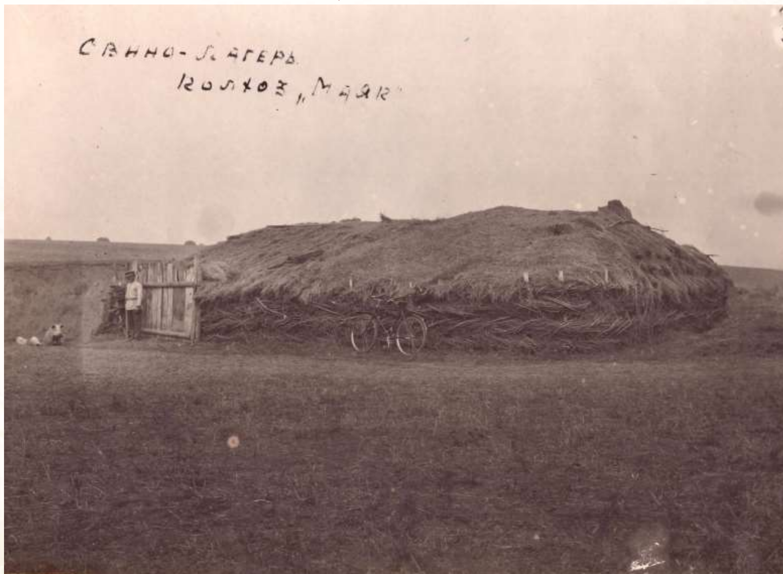
Свиной лагерь колхоза «Маяк»