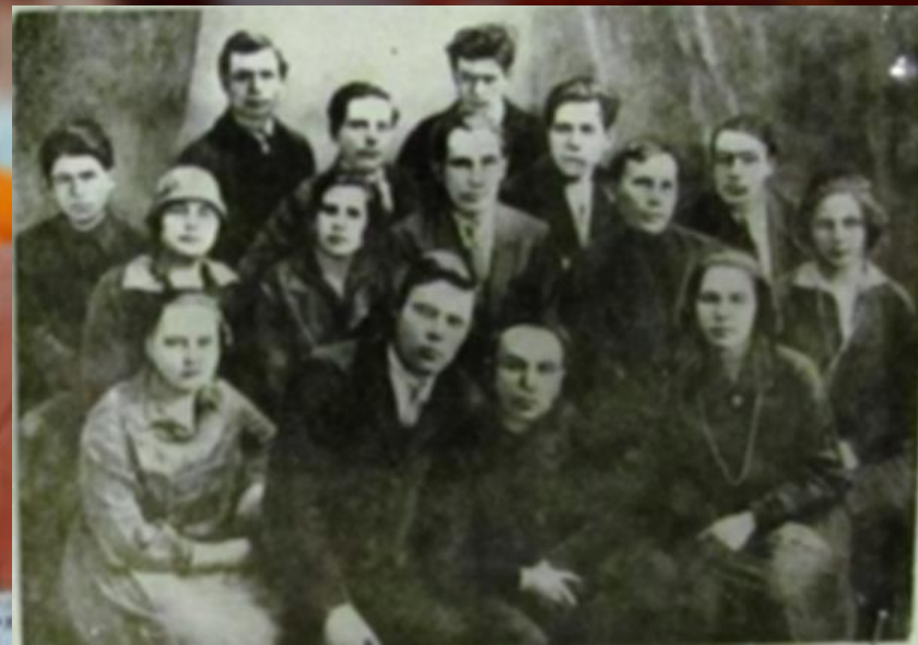
Иван Мучи Чăваш театрĕн артистчĕсемпе. 1927

1922 çулта театрпа пĕрле Шупашкара куçса килнĕ. Пĕр вăхăт «Канаш» хаçат редакцийĕнче вăй хунă.