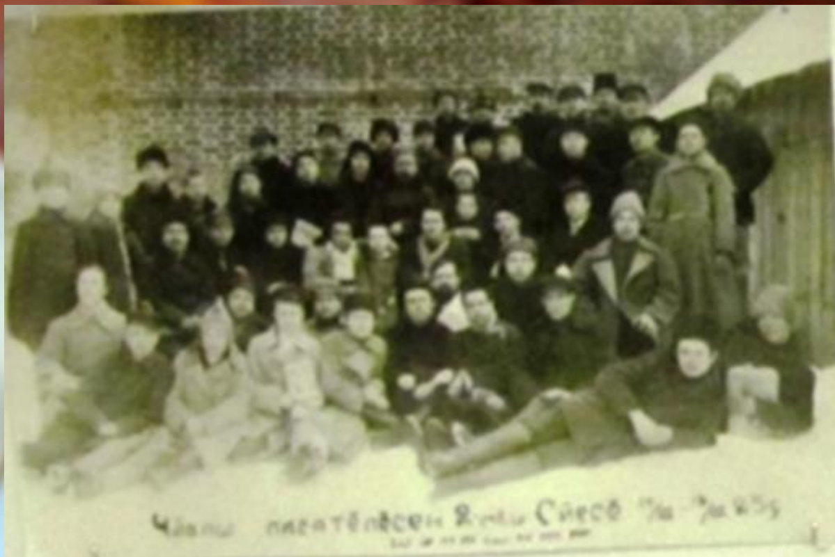
Чӱваш сиравсисем. 1925

Литературӑри ситӗнӱсемшӗн ӑна Чӱваш АССР Верховнӑй Совет Президиумӗн Хисеп грамотипе наградӑланӑ.