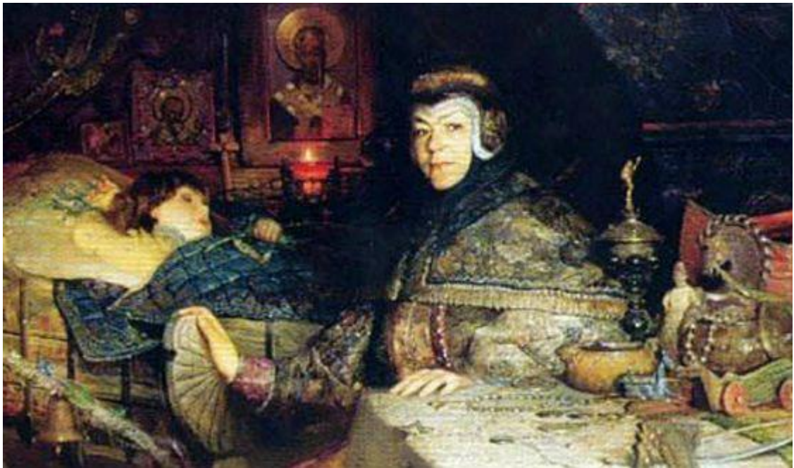
Наталья Нарышкина и младенец Петр. Художник Павел Рыженко

После кончины в 20-летнем возрасте царя Федора Алексеевича, не сделавшего распоряжений относительно наследника престола, родня его матери Марии Милославской, первой жены отца, посчитала, что новым царем должен стать следующий по старшинству ее 16-летний сын Иван, страдавший цингой и эпилепсией. Но боярский клан Нарышкиных при поддержке патриарха Иоакима выступил за кандидатуру своего ставленника – здорового царевича Петра, которому тогда исполнилось 10 лет.