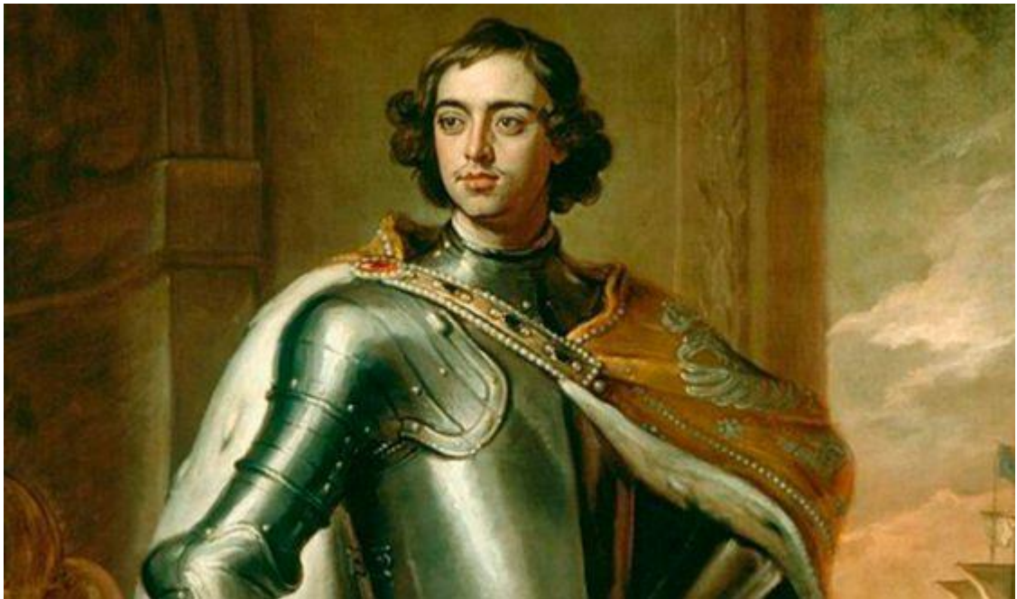
Петр Первый в молодости

В период 1697-98 гг. царь под именем бомбардира Петра Михайловича странствовал по Западной Европе, обзавелся важными знакомствами с главами государств и приобрел необходимые знания в кораблестроении и навигации.