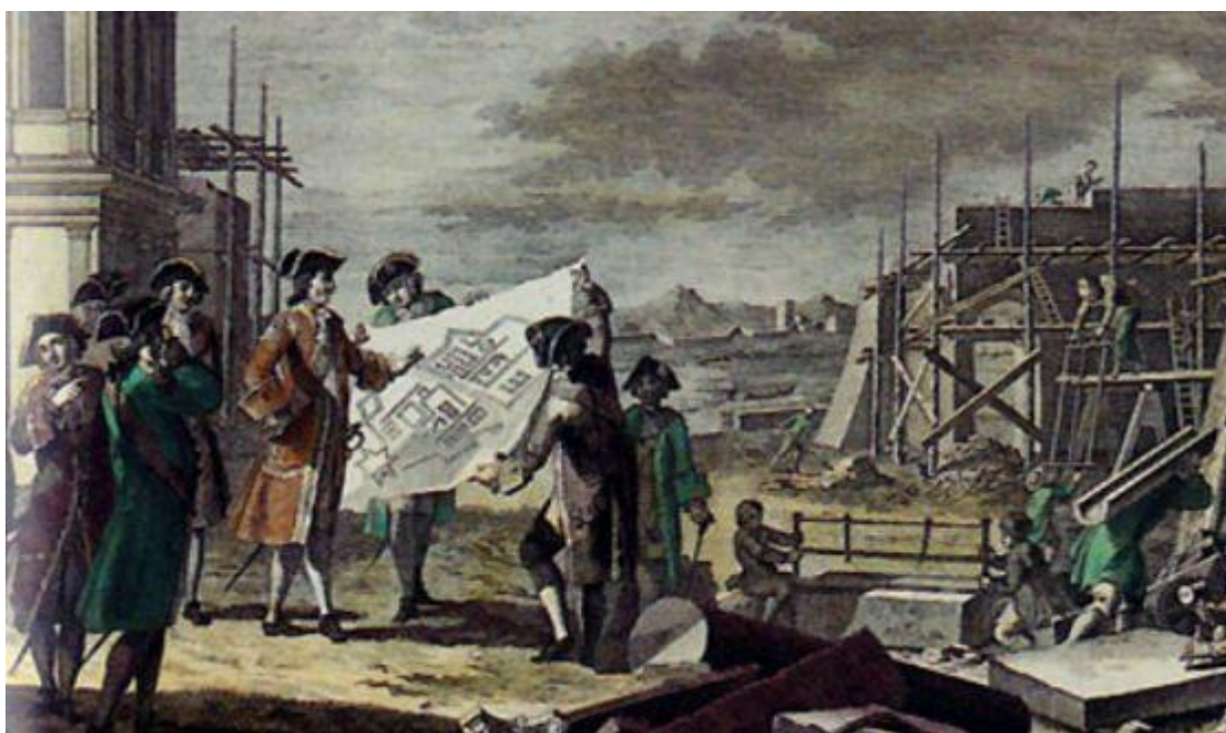
Петр I на строительстве Санкт-Петербурга. неизвестный художник, ок. 1830 г

Одновременно царь, отличавшийся целеустремленностью и сильной волей, проводил преобразования в управлении страной, рационализировал хозяйственную деятельность – обязывал купечество и дворянство развивать важные для страны отрасли промышленности, строить горные, металлургические, пороховые предприятия, возводить верфи, создавать мануфактуры.