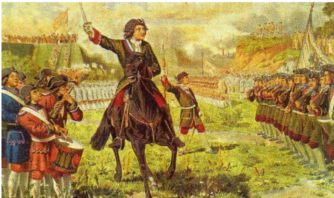
Потешное войско Петра Первого

своих сверстников так называемое «потешное войско» (для справки, в XVII веке «потеха» означало не забаву, а военные действия). Во время одной из таких «потех» Петру опалило лицо гранатой.