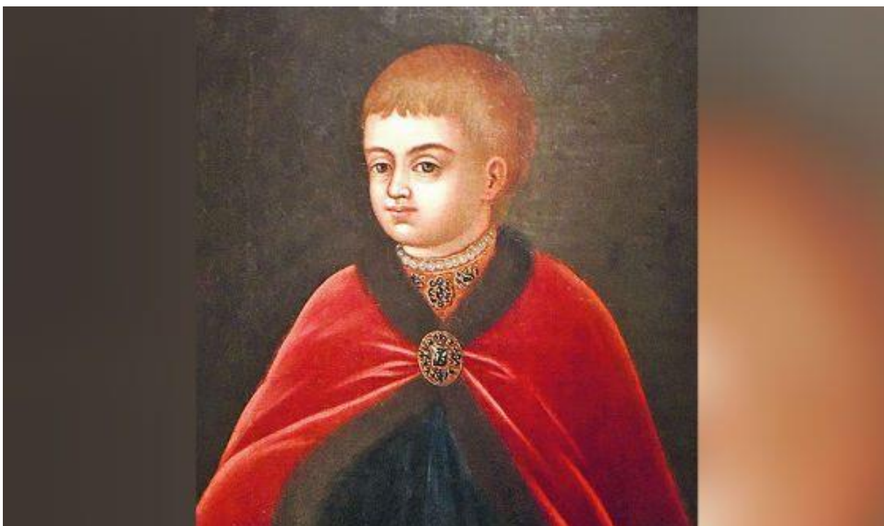
Петр I в детстве. Портрет кисти неизвестного художника.

Будущий император появился на свет 9 июня 1672 года в Москве. Он стал 14-м ребенком царя Алексея Михайловича и первым из троих детей его второй супруги, крымско-татарской княжны Натальи Кирилловны Нарышкиной.