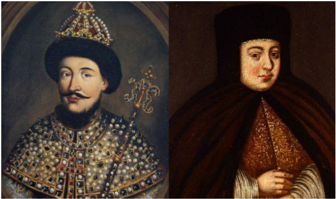
Родители Петра Первого: Алексей Михайлович Романов и Наталья Кирилловна Нарышкина

Мальчик рос крепким, живым, любознательным и активным ребенком. Его воспитанием занимались няньки, образованием – дьяки. Хотя впоследствии он имел проблемы с грамотностью (к своему 12-летию еще не освоил русскую азбуку), но с малых лет знал немецкий язык и, обладая отличной памятью, позже освоил английский, голландский, французский языки. Кроме этого, он изучил множество ремесел, включая оружейное дело, столярное, токарное.