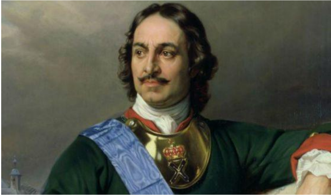
Портрет Петра Первого

Петр Алексеевич Романов (официальные титулы: Петр I Великий, Отец Отечества) – выдающийся монарх, сумевший произвести глубочайшие преобразования в государстве российском. За период его правления страна вошла в число передовых европейских держав и обрела статус империи. Среди его достижений – создание Сената, основание и строительство Санкт-Петербурга, территориальное деление России на губернии, а также усиление военной мощи страны, получение важного для экономики выхода к Балтийскому морю, активное использование в различных областях промышленности передового опыта европейских государств. Однако, по мнению ряда историков, необходимые стране реформы он проводил спешно, малопродуманно и крайне жестко, что привело, в частности, к сокращению населения страны на 20-40 процентов.