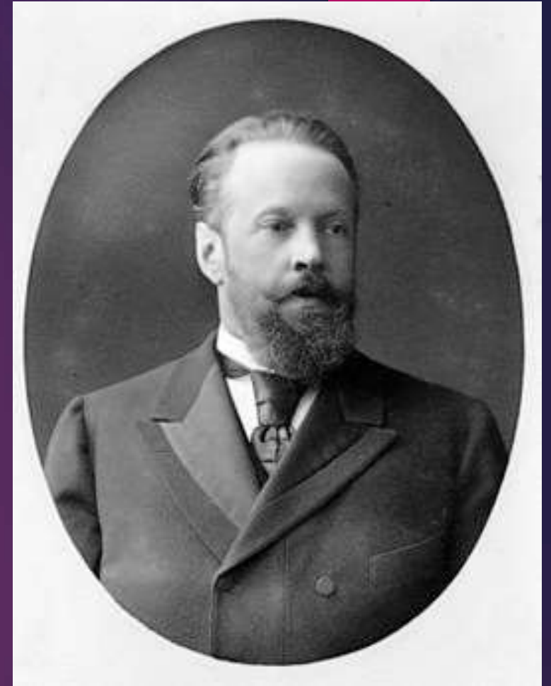
Сергей Юльевич Витте