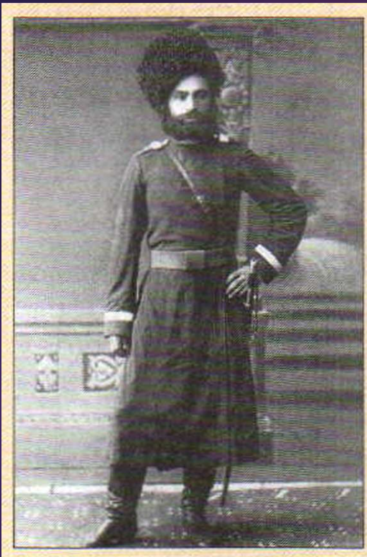
Казак Уральского войска. Фото 1891 г.