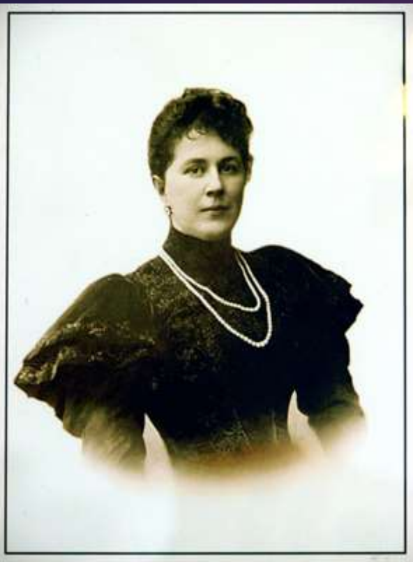
Мария Клавдиевна Тенишева

▶ Часть помещиков сумела приспособиться к рыночным условиям. Среди них выделялись образцовые экономии графа С.Д. Шереметева , имение «Хуторок» барона В.Р. Штейгеля , имение «Казацкое» князя П.Н. Трубецкого и др. Некоторые помещичьи имения были «культурными гнездами», как их называли современники: в них располагались прекрасные библиотеки, художественные галереи, музеи и даже собственные театры. Например, в с. Талашкино Смоленской губернии княгиней М.К. Тенишевой был открыт Музей народных промыслов.