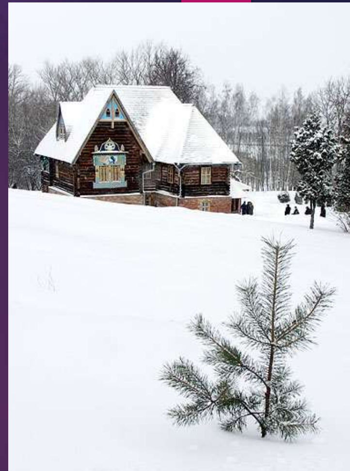
Теремок в Талашкино

▶ Часть помещиков сумела приспособиться к рыночным условиям. Среди них выделялись образцовые экономии графа С.Д. Шереметева , имение «Хуторок» барона В.Р. Штейгеля , имение «Казацкое» князя П.Н. Трубецкого и др. Некоторые помещичьи имения были «культурными гнездами», как их называли современники: в них располагались прекрасные библиотеки, художественные галереи, музеи и даже собственные театры. Например, в с. Талашкино Смоленской губернии княгиней М.К. Тенишевой был открыт Музей народных промыслов.