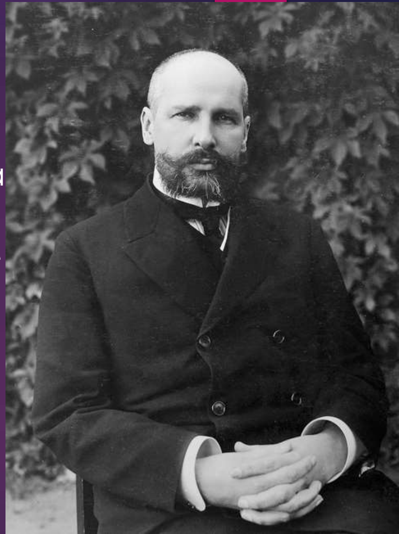
Петр Аркадьевич Столыпин