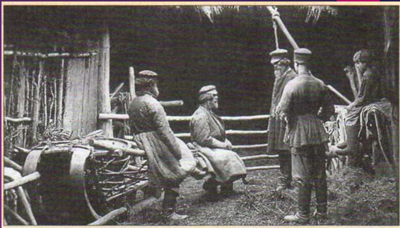
Крестьяне. Можайский уезд. Деревня Кукарино. Фото 1898 г.