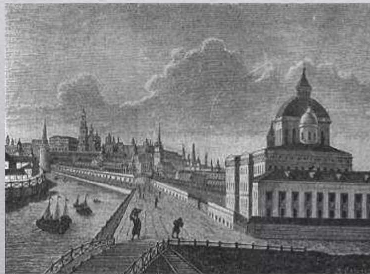
Первоначальный вид Воспитательного дома в Москве

В 1775 году были открыты совестные суды , к ведомству которых было отнесено рассмотрение преступлений, совершенных малолетними.