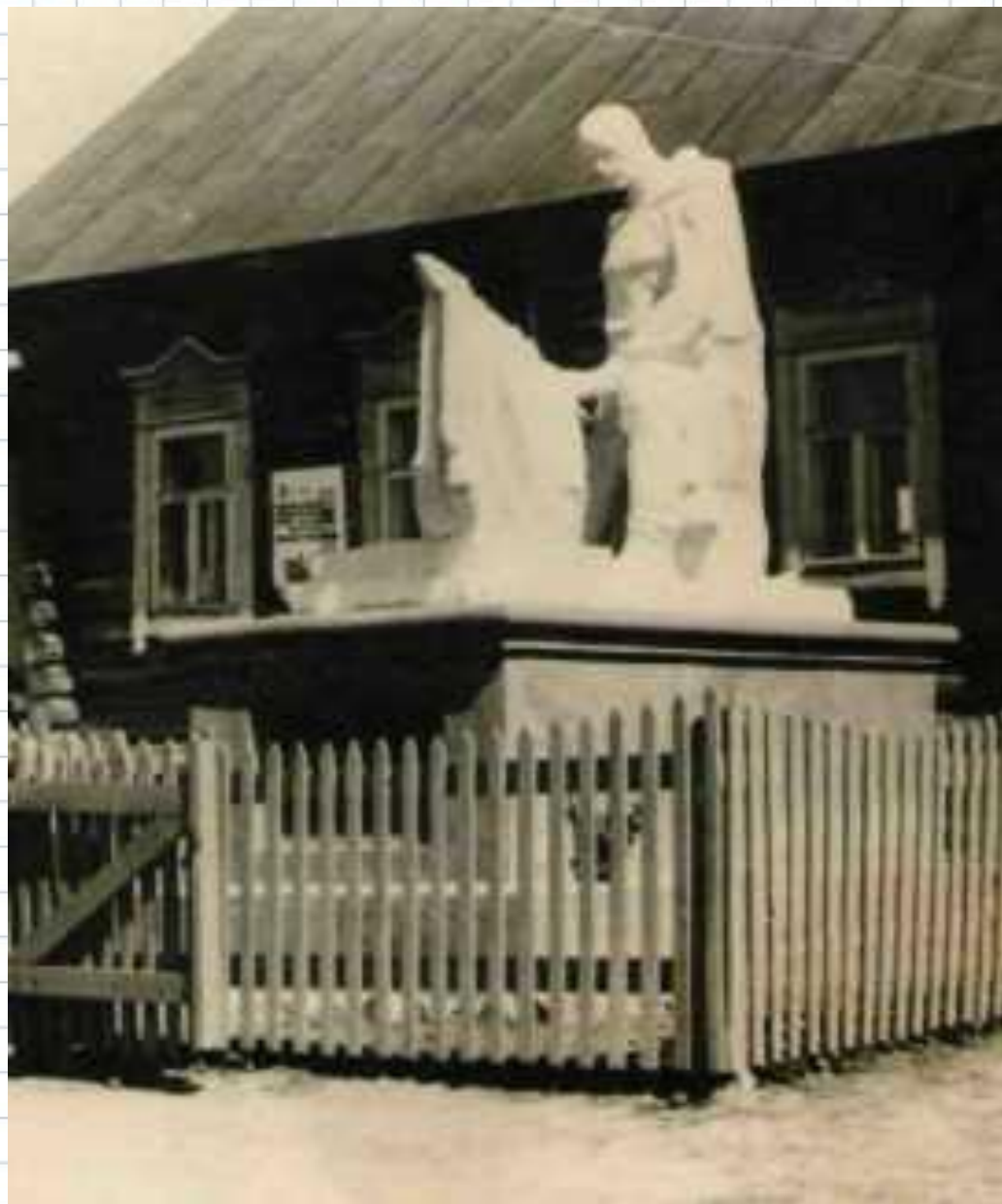
1 сентября 1953 года открыли сельскую библиотеку. Деревянное здание перевезли из деревни Завражное.