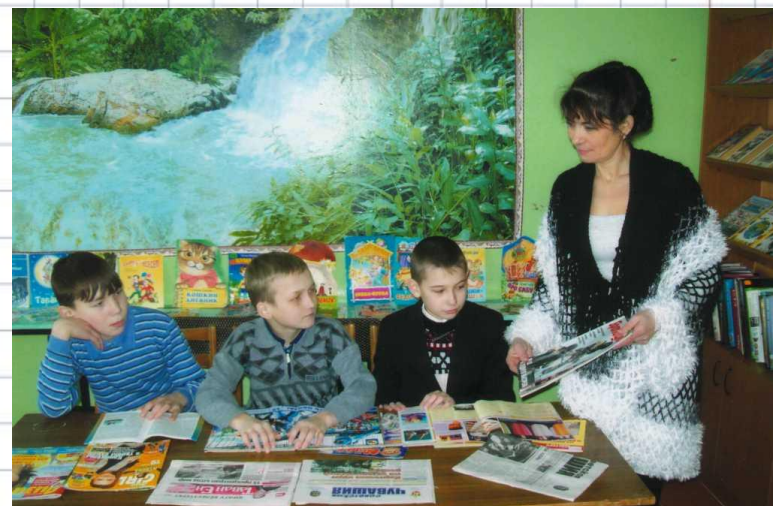
В читальной зале.