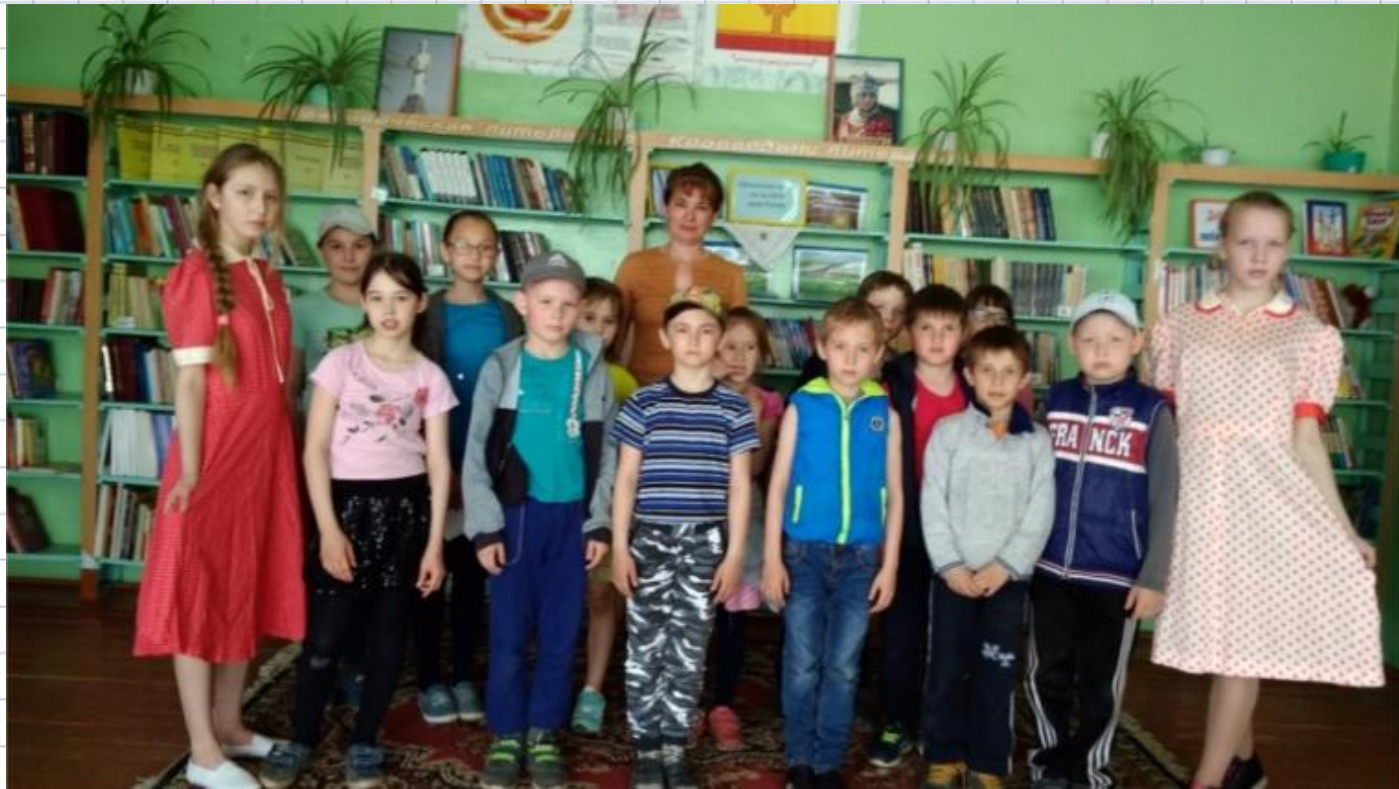
Фото на память, после мероприятия