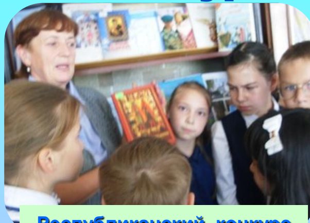
Республиканский конкурс «Ожившая книга»