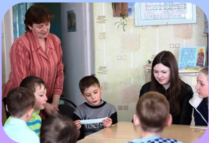
Акция «Читаем детям о войне»