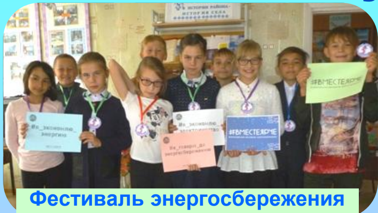
Фестиваль энергосбережения «Вместе ярче»