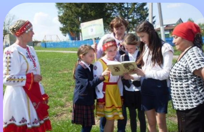
Международная акция «Читаем вместе Константина Иванова»