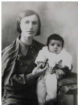
Галина Андреевна хайён Людмила ятлă хёрёпе.