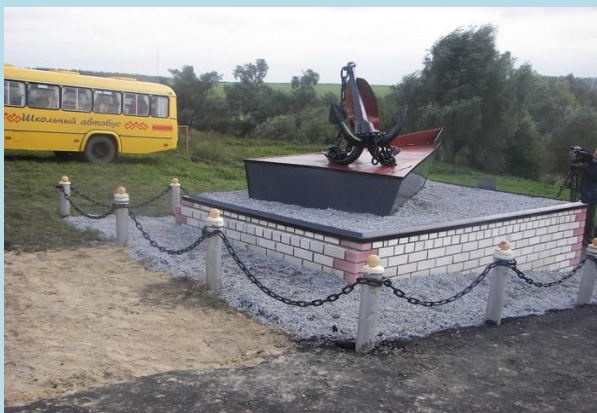
Памятный знак. На этом месте стоял дом, в котором родился академик-кораблестроитель А.Н. Крылов.

Алексей Николаевич Крылов родился 15 августа 1863 г. в селце Висяга. В 1963 г. в честь 100-летия со дня рождения академика А.Н. Крылова деревня переименована в д. Крылово, Порецкого района, Чувашской Республики