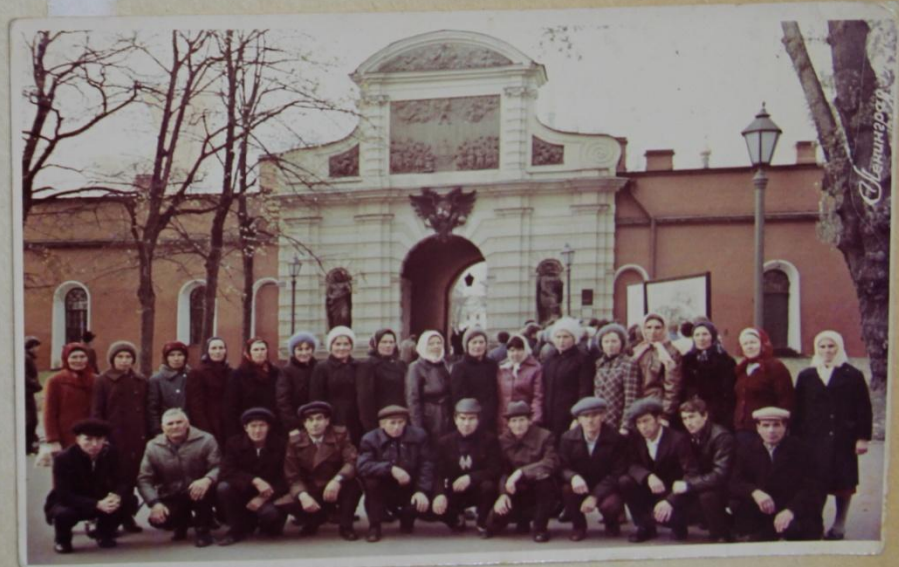
Иванова" колхоз турникёсем Ленинградра

Ялухсалах работникёсен профсоюзё уйёрна путевкасемпе те чылай колхозниксем санаторисемпе курортсене сывлёха ёирёплетме кайрёс.