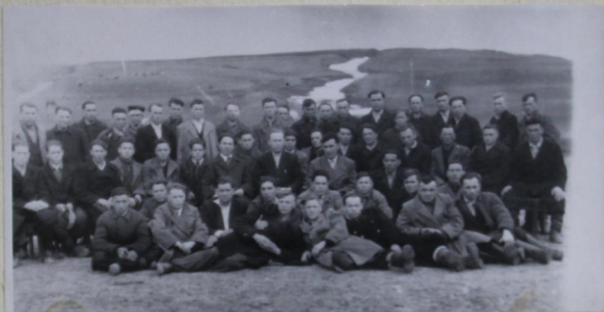
1960 ҒУЛХИ ҒУРАКИ УМЁН