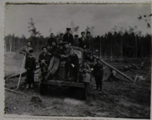
Д.М.ТИТИЛКИН ШОФЕР ЁСРЕ

ВЫЛБӀХ-ЧЕРЛӀХ ОТРАСЛЬНЕ АТАЛАНТАРМА ҢЕНӀ ҢУРТ-ЙӀР ЛАРТМАМА, КИВВИСЕНЕ ЮСА- МАЛЛА. А.И.ЖАНДАРМОВ УЛАТАР ВАРМАНЕНЧЕ ҢУЛСЕРЕН ПИНШЕР КУБЛА МЕТР ЙЫВӀС ХАТӀР- ЛЕТТЕРЧӀ. 2 ҢУЛТА КАНТАР ЗАВОЧӀ, СЫСНА ВИТИСЕМ ИККӀ, ТЫРА КӀЛЕЧӀСЕМ, 250 ПУҢ ВАЛЛИ ПӀРУ ВИТИ, ФЕРМАРА ЕҢЛЕКЕНСЕМ ВАЛЛИ ОБЩЕЖИТИ, МЕХАНИЗАЦИЛЕНӀ АРМАНСЕМ, ПИЛОРАМА ТУСА ЛАРТНА. ЯЛ ҢЫННИСЕМ ТЕ ҢӀНӀ ҢУРТСЕМ ЧЫЛАЙ ТУНА.