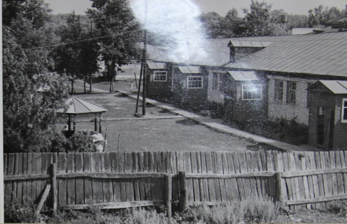
„Туслáх” пионер-лагерь сëкленчë