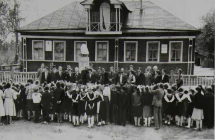
Колхоз пулášнипе Пантьáкра шкул-музей уšáлчë