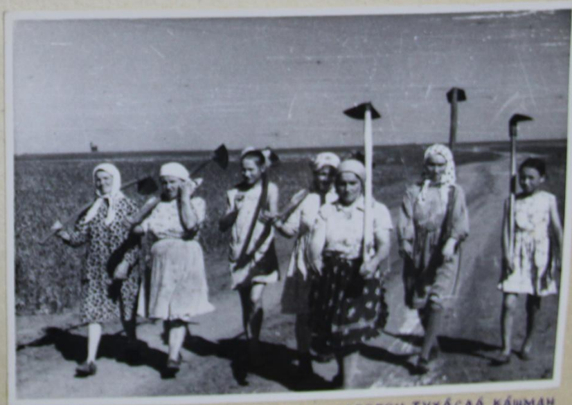
3-меш Бригада Членёсем Суасорен ТухаҒла Кашман Уста РеҒеҒе