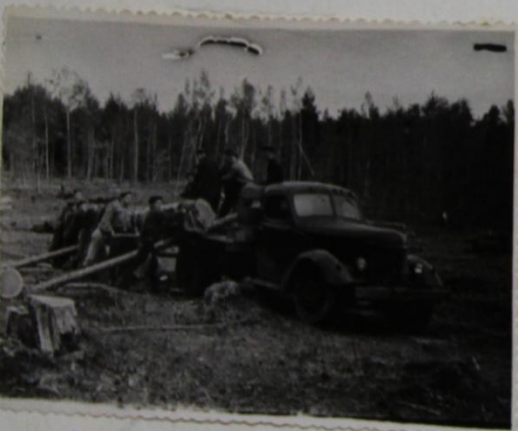
ВАРМАН ЕҢЛОМЕ ҢАМАЛ МАР.