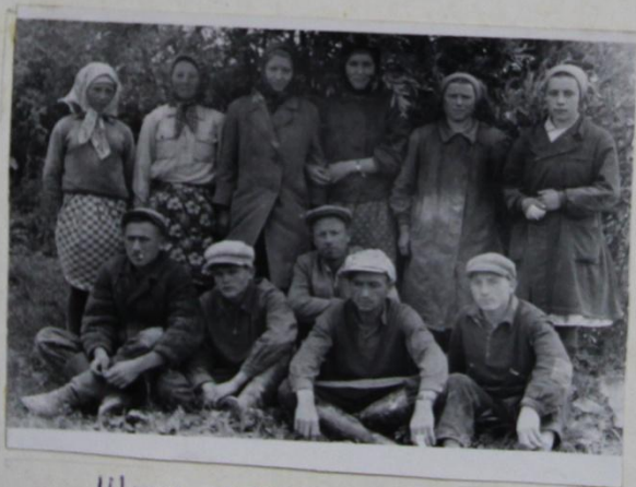
ШКУЛ ҢУРТНЕ КУПАЛАССЕ.