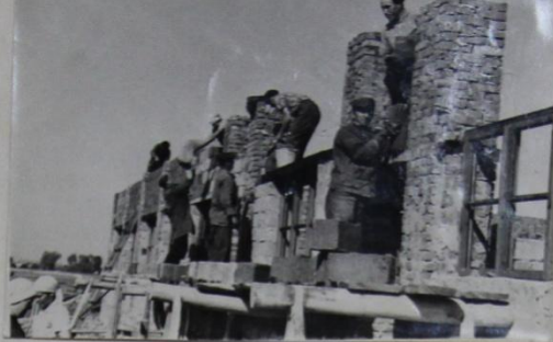
ЮСАВ МАСТЕРСКОЙНЕ ТАВАССЕ