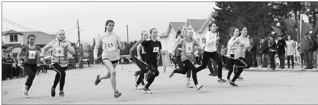
«Манән райпо» конкурс

Сән үкерчөксөнчө: стартра – вәтам шукулта вөрөнөксөм; Андреевсен сөмьө – сөнтөрүсө.